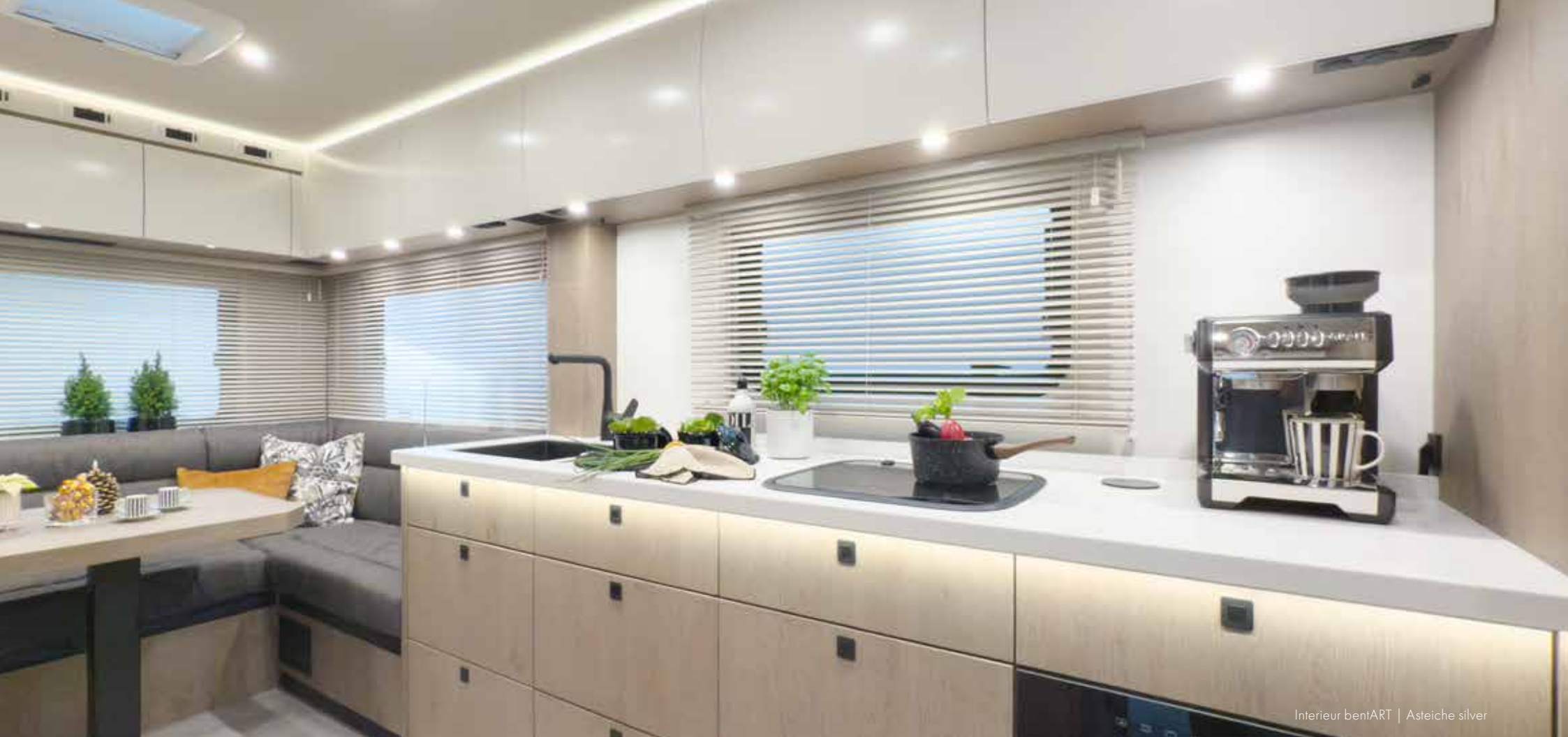
Interieur bentART | Asteiche silver