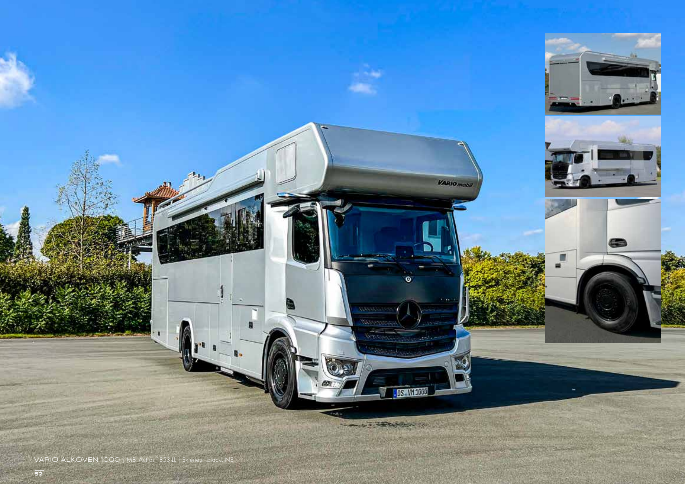
VARIO ALKOVEN 1000 | MB Aetros 1853 LL | Extérieur 'blackLINE'