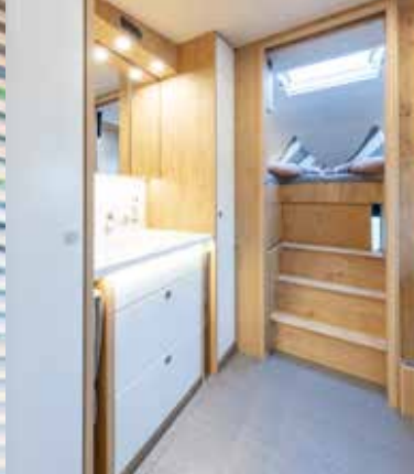
Ausziehbare Treppe zum extrahohen XXL Alkovenbett | Schiebetür zum Fahrerhaus