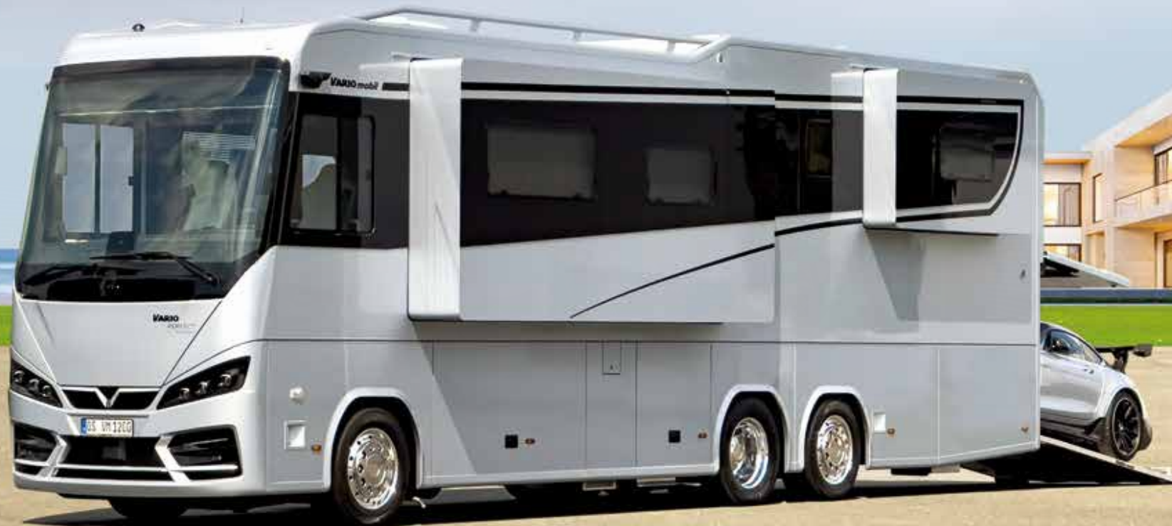
VARIO SLIDE OUT - pneumatisch dichtend, Beheizung der Außenfläche, exakte Spaltmaße von Erkersystem, Türen und Klappen, hochwertiges Autolacksystem, elegante Metalllackierung rundum

DIE AUSFAHRBARE VARIO ERKERTECHNIK erlaubt Ihnen ein uneingeschränktes Raumgefühl. Herausgefahren werden im Wohnbereich die Dinette und Küche samt der komfortablen Leder-Lounge. Im Schlafraum können das Queensbett und ein zusätzliches Sofa ausgefahren werden.