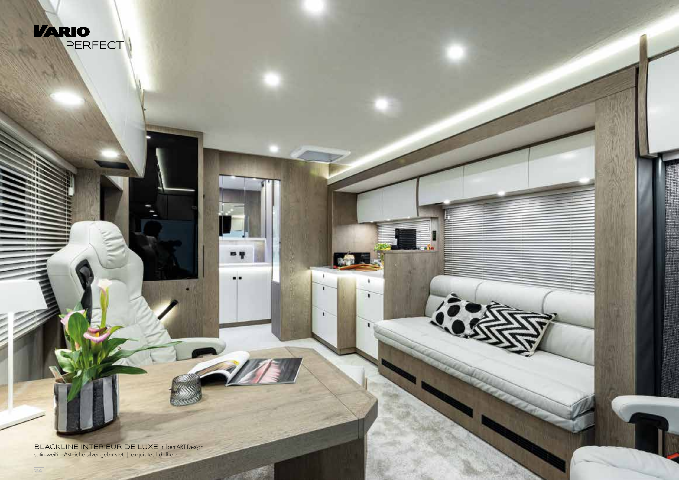
BLACKLINE INTERIEUR DE LUXE in bentART Design satin-weiß | Asteiche silver gebürstet, | exquisites Edelholz