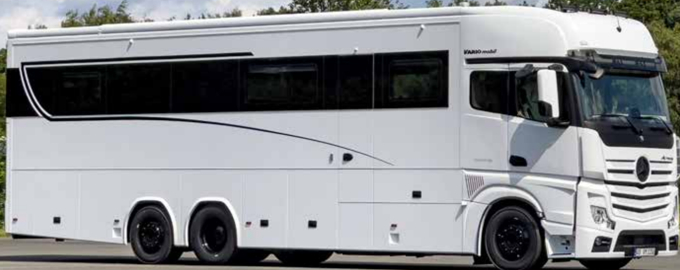
VARIO SIGNATURE 1200 „blackLINE“ | mit rundumlaufendem Echiglas Lichtband und nahtlos eingelassenen Ausstellfenstern