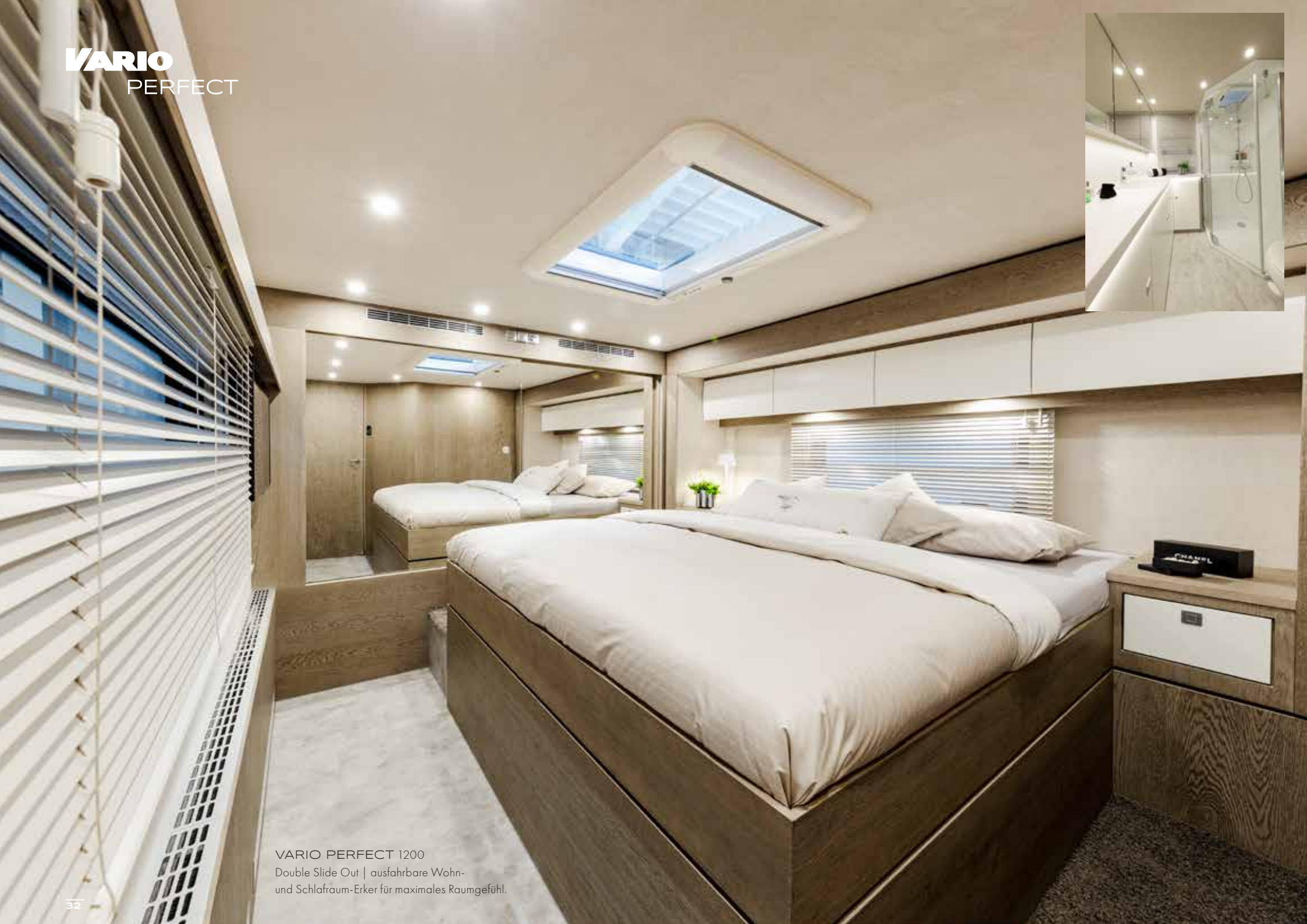
VARIO PERFECT 1200 Double Slide Out | ausfahrbare Wohn- und Schlafraum-Erker für maximales Raumgefühl.