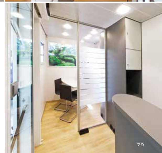
VARIO 580 Kofferaufbau | IVECO Daily