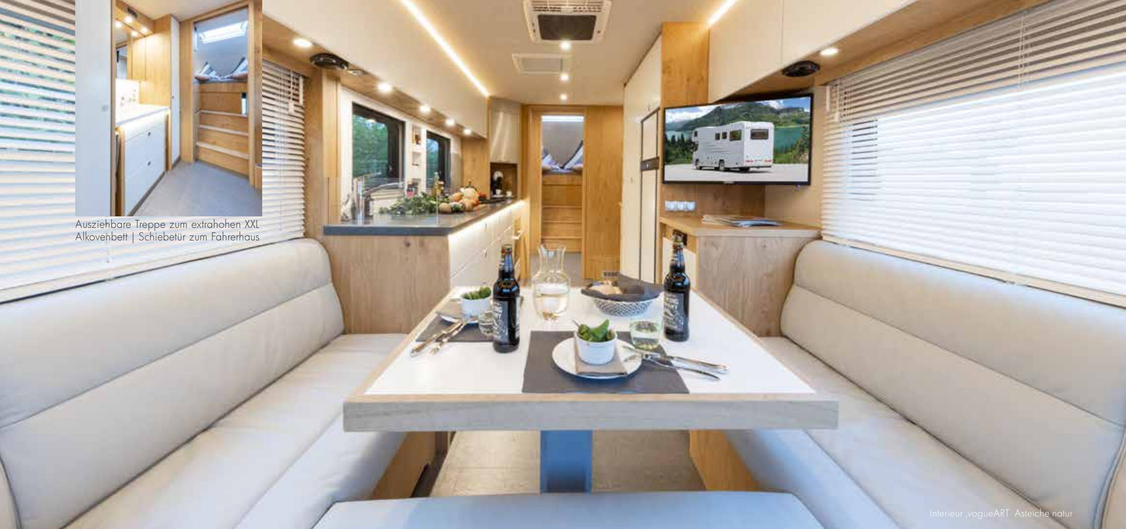
Interieur ,vogueART Asteiche natur