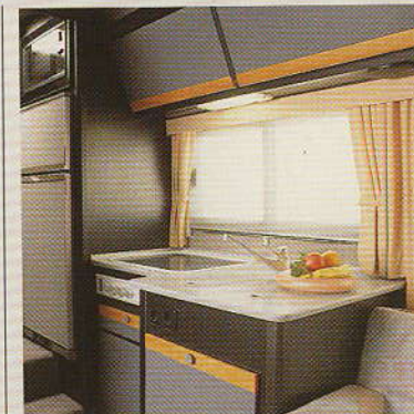
3: Küche mit CORIAN-Arbeitsplatte