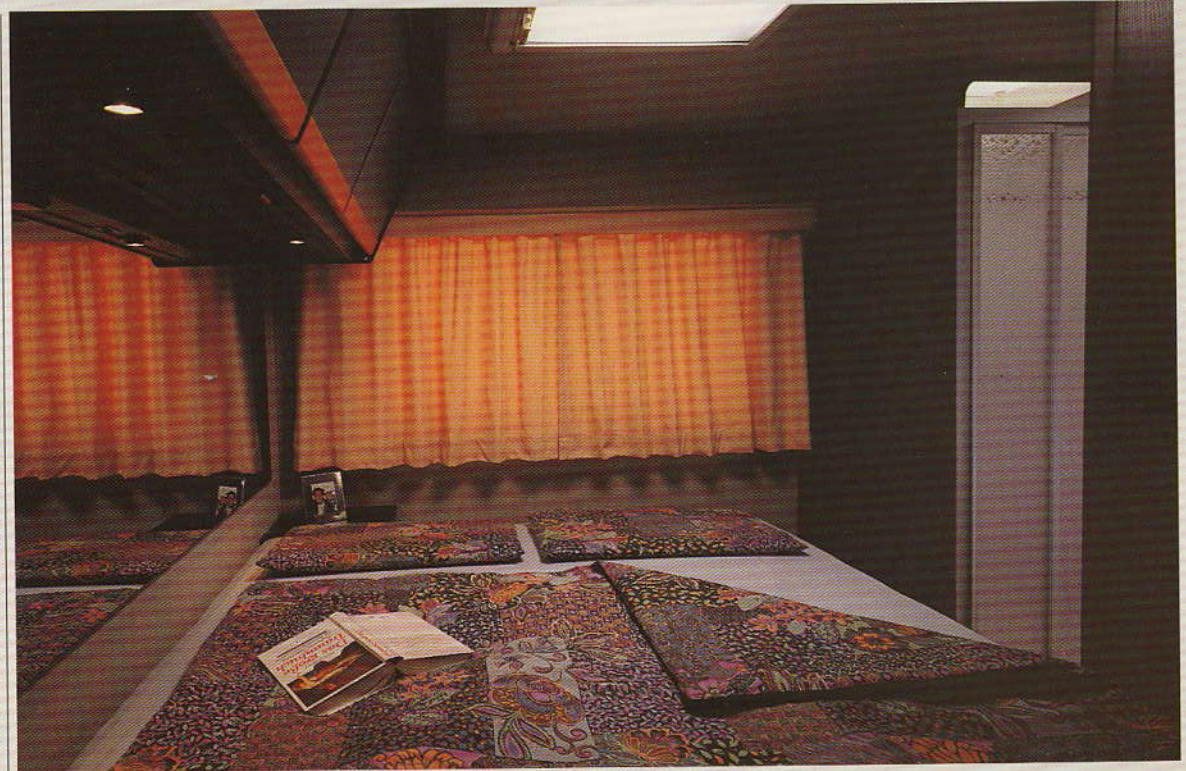
2: Schlafzimmer ClouLINER 800 Doppelbett: 200x140cm