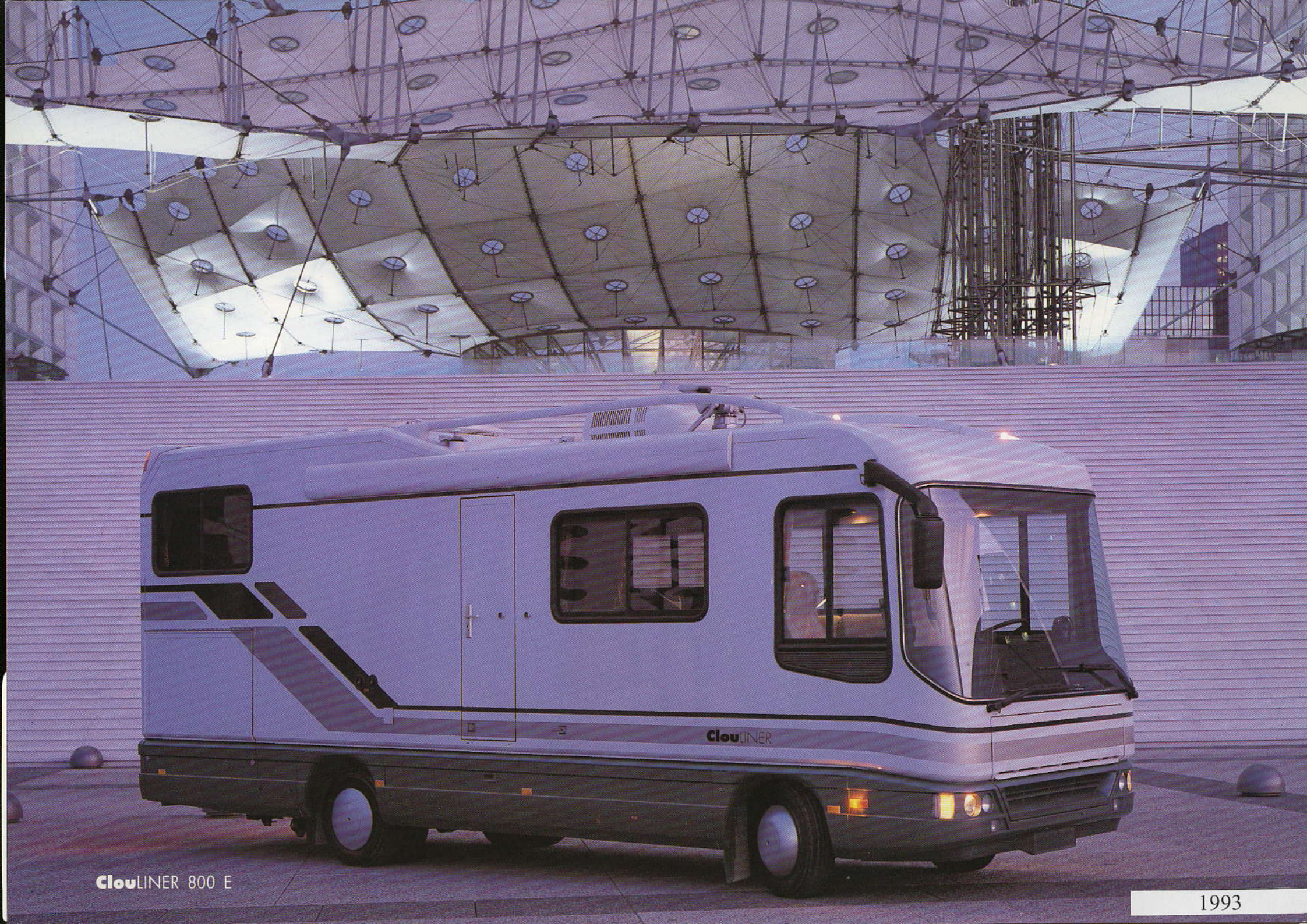
Clouliner 800 E