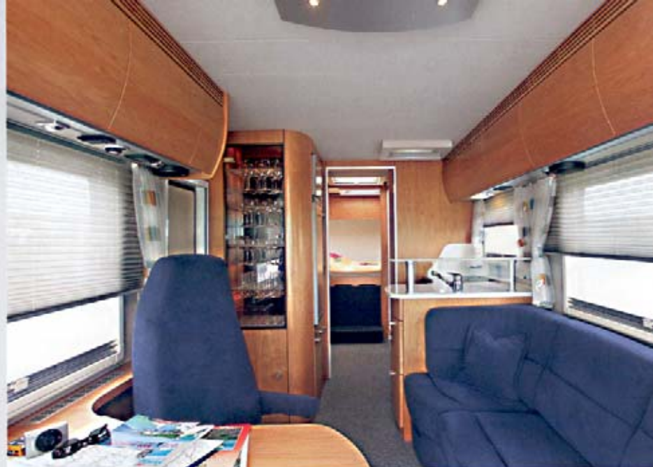
ClouLINER 750 AS, Holzdekor: Linea Akzenta, Polster: Alcantara Domino blau

nach individuellen Vorgaben maßgeschneidert. So viel Flexibilität setzt sich bei der Innenausstattung fort: Beeindruckend ist nicht nur die umfangreiche Serienausstattung, sondern auch die Vielseitigkeit der Möbeldekore, Wand- und Bodenbeläge, Stoffe und Polster. Suchen Sie einfach aus, was perfekt mit Ihrem persönlichen Stil harmoniert. Ganz wie zu Hause!