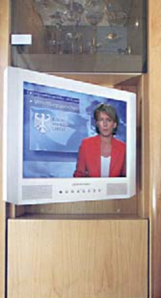
TFT unter dem Barschrank

Schön, wenn man auch im Urlaub überall mühelos mitverfolgen kann, was in der Welt passiert: Der hochmoderne Flachbildschirm-Fernseher sorgt für beste Fern-Sicht und kann wahlweise unter dem Barschrank oder im Frontschrank – mit elektrischer Absenkung (SA) – eingebaut werden.