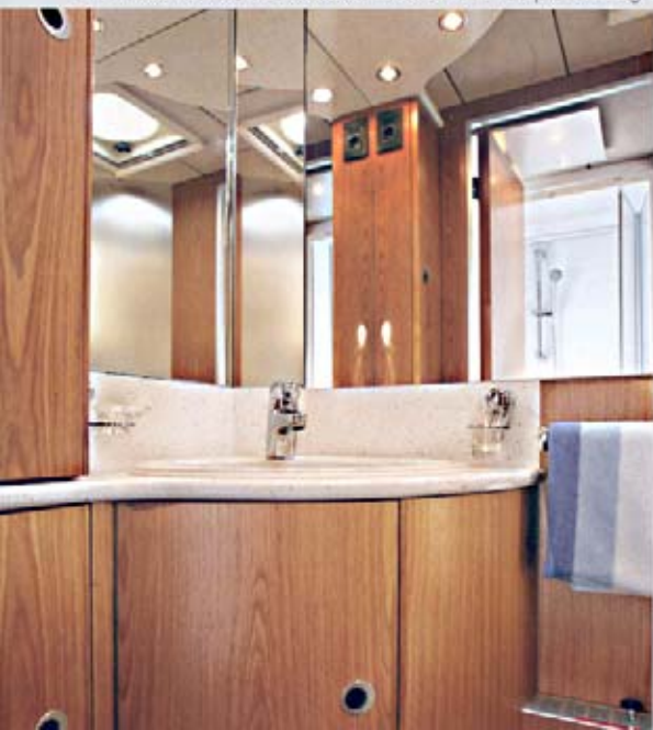
ClouLINER 650 C, Mineralwerkstoff-Oberfläche in Alpina-Mélange

Großzügig bemessene und geschickt beleuchtete Spiegelfronten vergrößern optisch den Raum. Vielfältige Bad-Accessoires wie z. B. ein praktischer Papierhalter, die Seifenschale und die Handtuchstange bieten maximalen Komfort und zeigen einmal mehr die Liebe zum intelligent konzipierten Detail, die für das entscheidende Plus an Luxus und Komfort in diesen exklusiven Reisemobilen sorgt. Tatsächlich ist bei dieser Bad-Konzeption einfach an alles gedacht, was das Reisen angenehmer macht. Der CLOU bietet somit einen mobilen Wellness-Urlaub – und hat zu diesem Zweck nach dem Auftanken sogar bis zu 250 Liter Frischwasser mit an Bord. Erfrischend durchdacht!