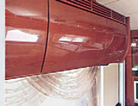
Linea Moderna (SA)

Echtholz furnier, europ. Kirschbaum in Hochglanzlackierung