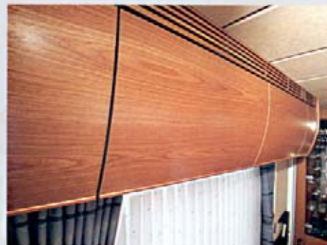
Linea Romantika, Holzfurnier, Design Kirsche-Cognac