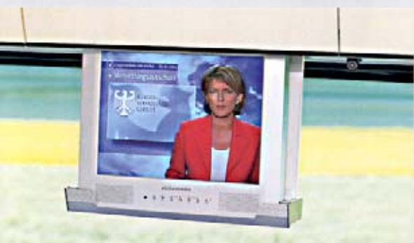
TFT im Frontschrank