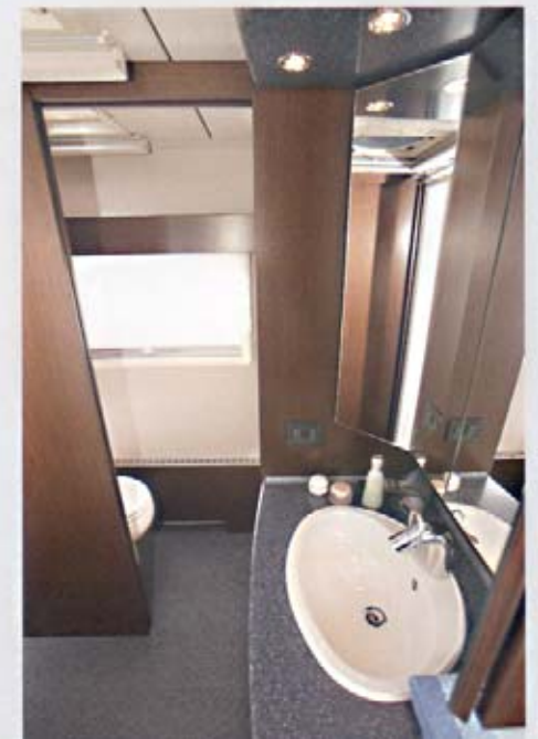
ClouLINER 750 DS, Mineralwerkstoff-Oberfläche in Acadia-Mélange

Eine Wahl, die allerdings gar nicht so leicht fällt: Beide Badvarianten verwöhnen mit einer eleganten und behaglichen Ausstattung mit edlen Hölzern und hochwertigen Mineralwerkstoff-Oberflächen – z. B. in schickem Midnight-Mélange.