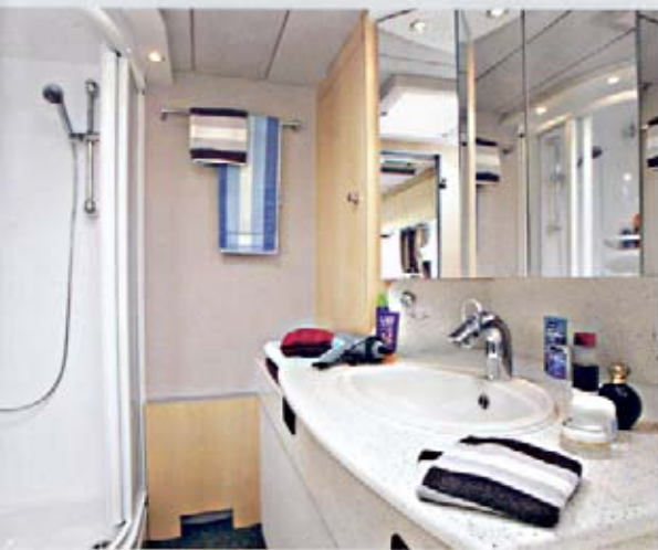
ClouTREND 650 A, Mineralwerkstoff-Oberfläche in Alpina-Mélange