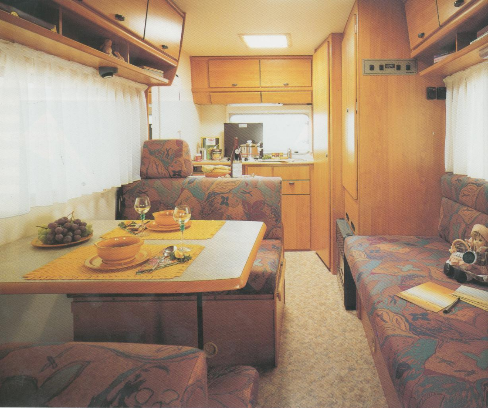
Camp-Swing 544 in Stoffkombination Padua.