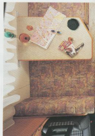
Seitensitzgruppe und Küche im Camp-Swing 544.