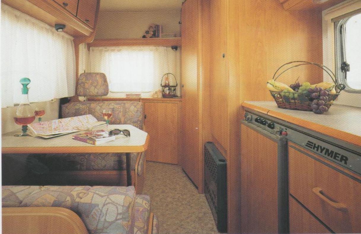
Camp-Swing 494 in Stoffkombination Luzern.