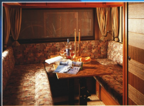
Die Sitzgruppe bietet viel Platz für eine gesellige Runde.

Änderungen in der Konstruktion, in der Ausstattung sowie eine Gewichtsänderung von +/- 5% behalten wir uns vor.