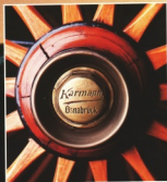
Karmann-Tradition: Reisewagen seit 1874.