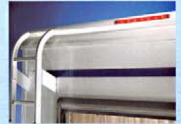
Dachheckspoiler mit dritter Bremsleuchte.