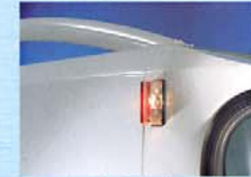
Eine spezielle Technik verbindet Wände und Dach kältebrückenfrei.