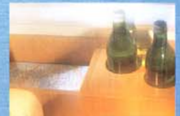
Im Fahrerhaus: kippstärkerer Platz für Getränke.