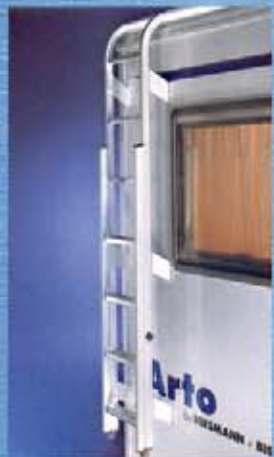
Die optionale Heckleiter aus formstabiler Aluminiumlegierung.