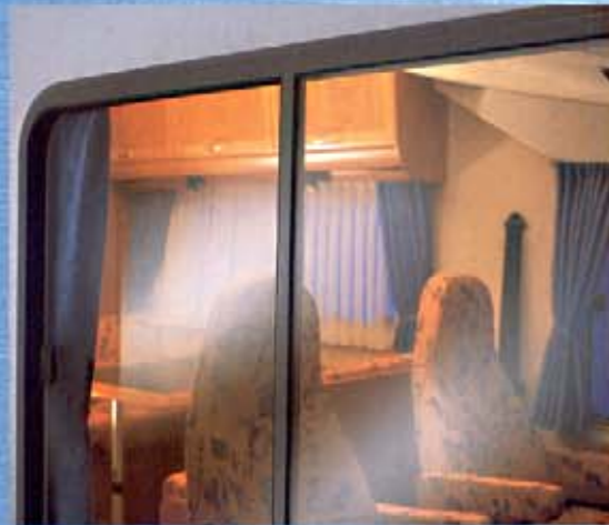
Fahrer- und Beifahrerfenster in doppelter Isolierverglasung.