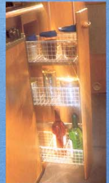
Raumgewinn in der Küche durch praktischen Korbauszug.