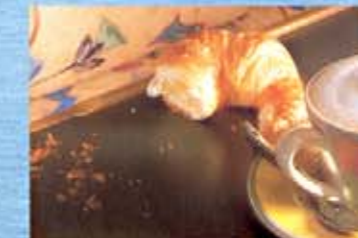
Die praktische „Krümelkante“ des Tisches.