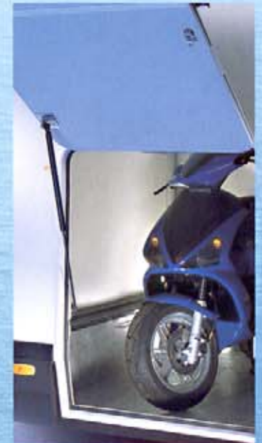
Große Seitenklappe zur Garage.