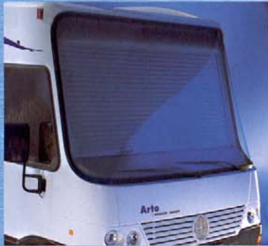
Führerhaus mit Klimarollo.