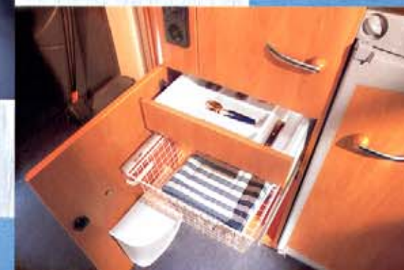
Übersichtliche und praktische Küchenmöbel.