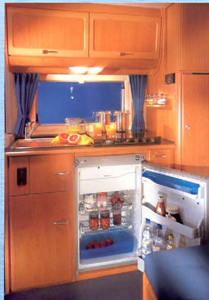
Die Küche im Arto 69G.

Wer einen Arto fährt zeigt Geschmack. Es werden ausschließlich qualitativ hochwertige Materialien verarbeitet. Das Niveau, auf dem sich Stoffe und Hölzer präsentieren passt zum Bild eines modernen und kultivierten Reisemobils. Noch nie war es so unkompliziert, für den Urlaub mit luxuriösen und praktischen Dingen gewappnet zu sein.