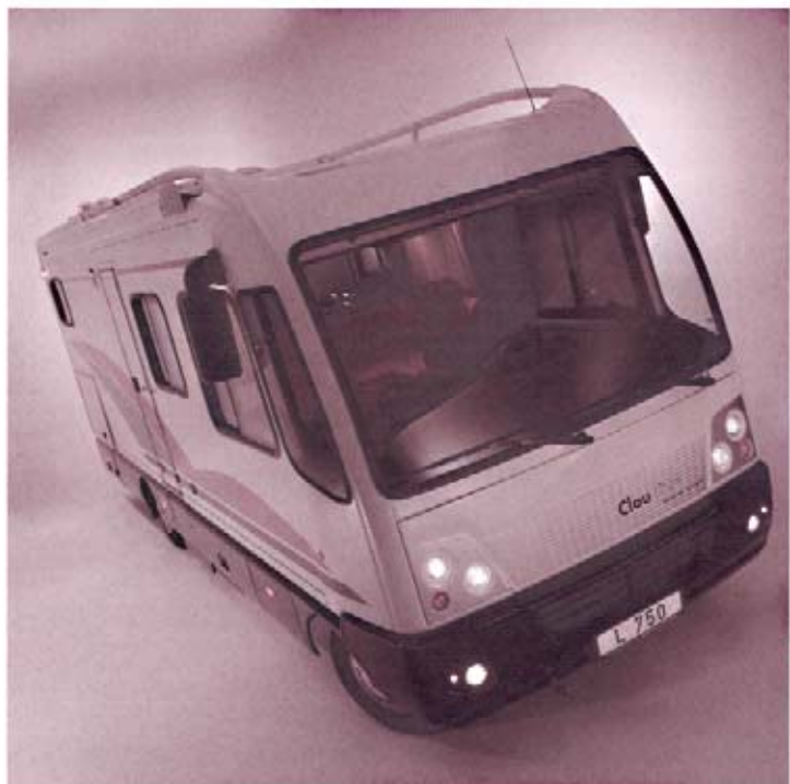
Clou LINER 750