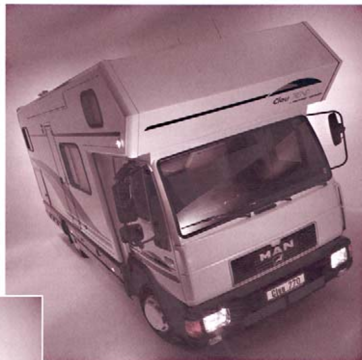
Clou TREND 770