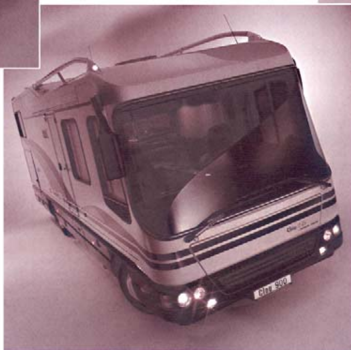
Clou LINER 900