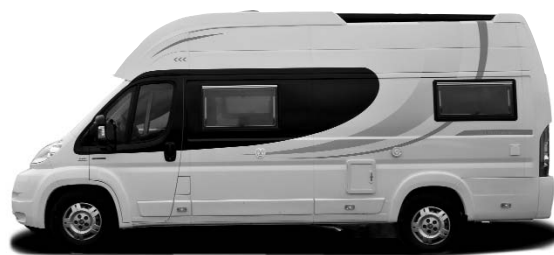
VOYAGER X, Y, Z