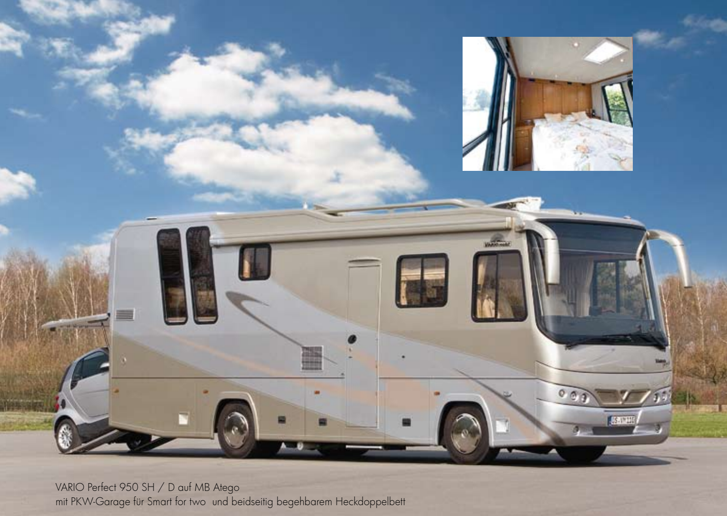
VARIO Perfect 950 SH / D auf MB Atego mit PKW-Garage für Smart for two und beidseitig begehbares Heckdoppelbett