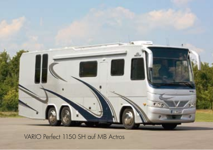
VARIO Perfect 1150 SH auf MB Actros