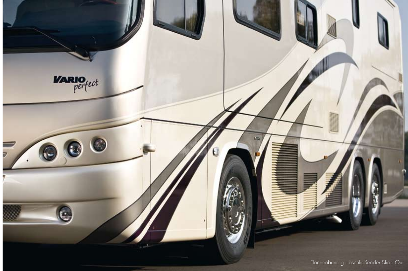
Flächenbündig abschließender Slide Out