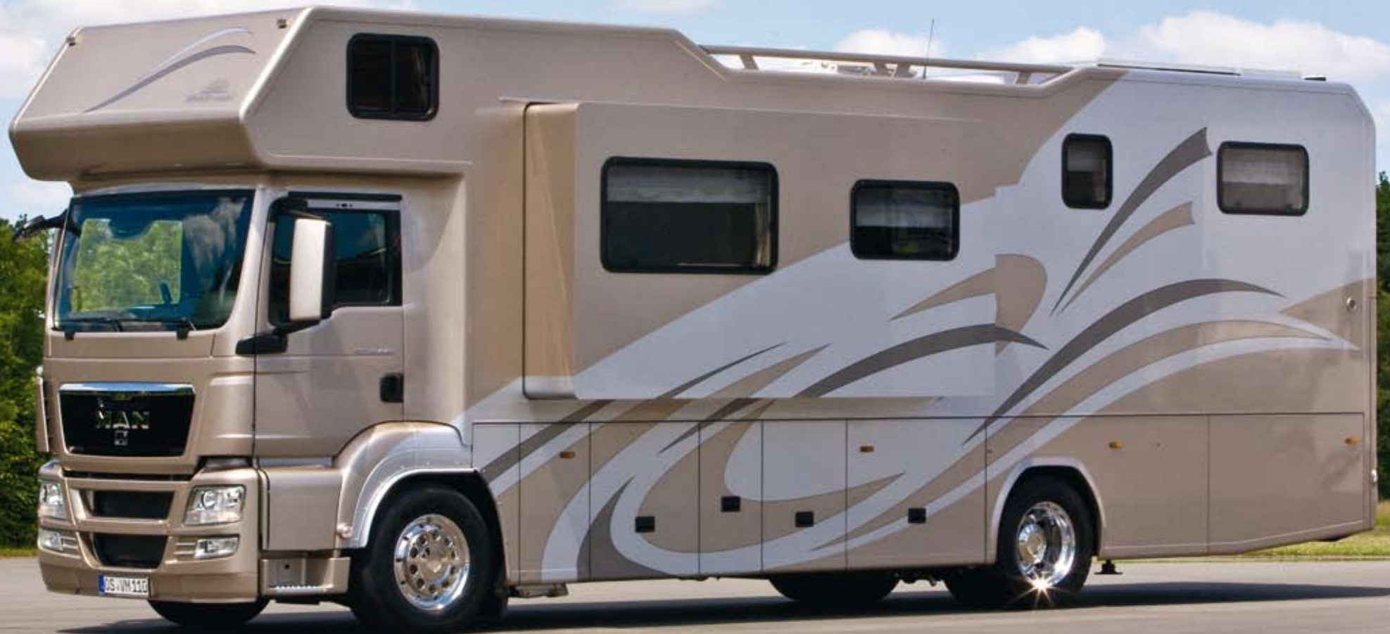
VARIO Alkoven 1100 auf MAN TGS mit ausfahrbarem Wohnraumerker und PKW-Garage für Toyota IQ