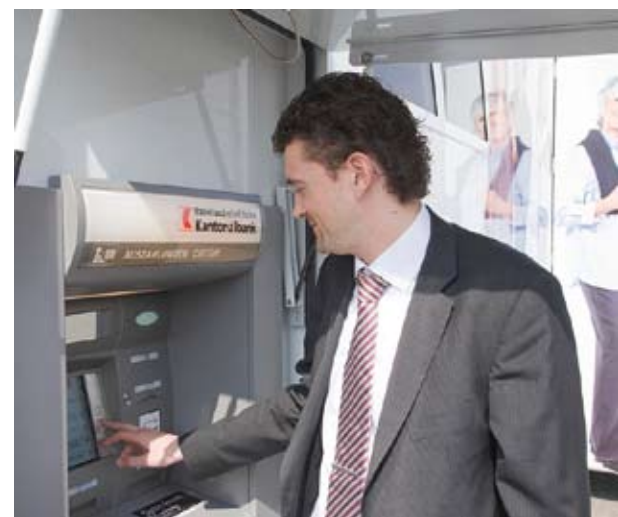
Barrierefreier Zugang / Rollrampe des VARIO mobile banking system