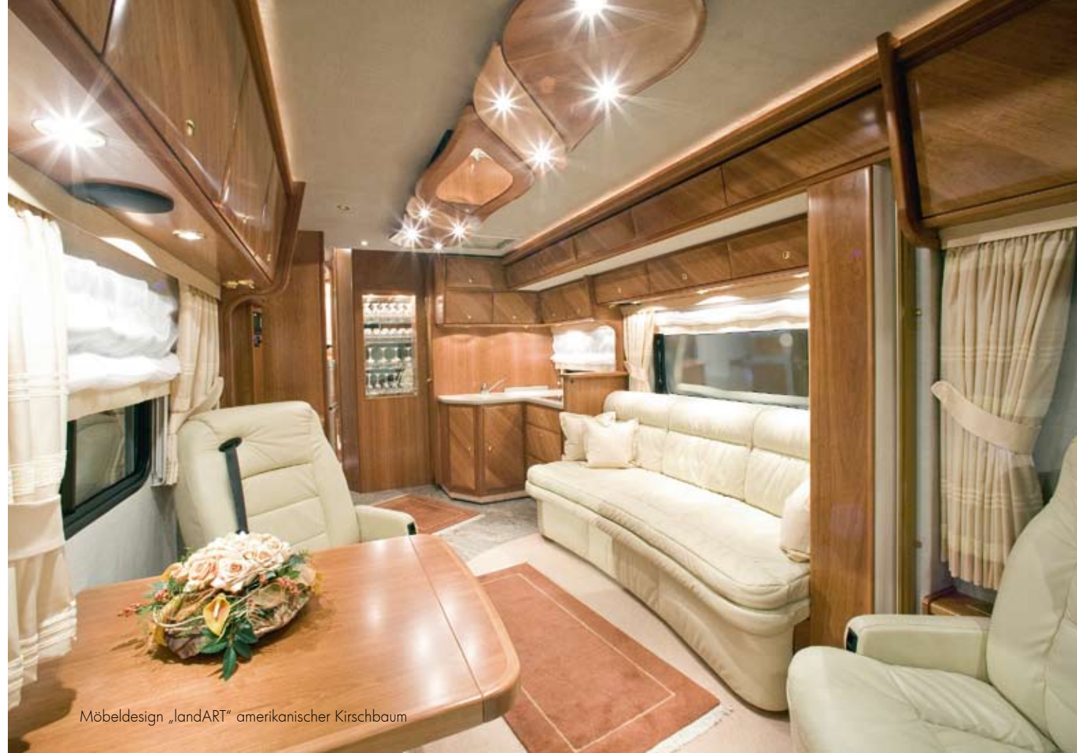
Möbeldesign „landART“ amerikanischer Kirschbaum