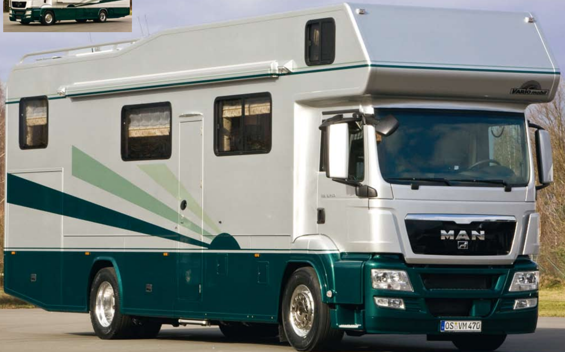
VARIO Alkoven 1000 auf MAN TGS mit ausfahrbarem Wohnraumker