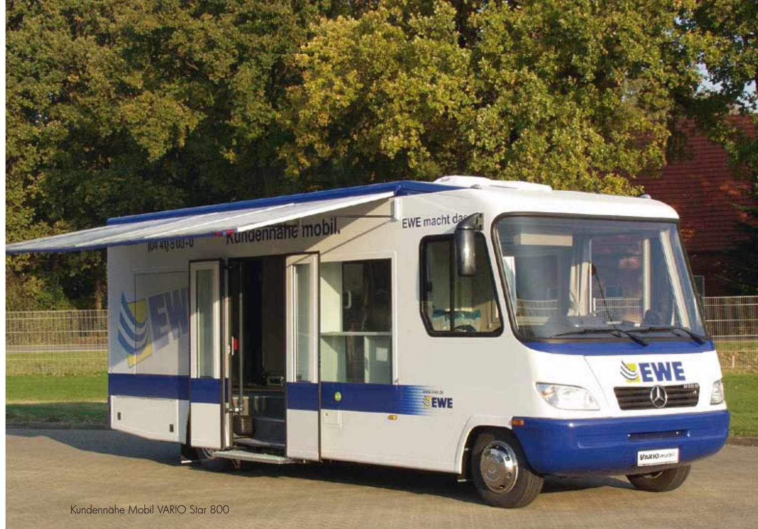
Kundennähe Mobil VARIO Star 800