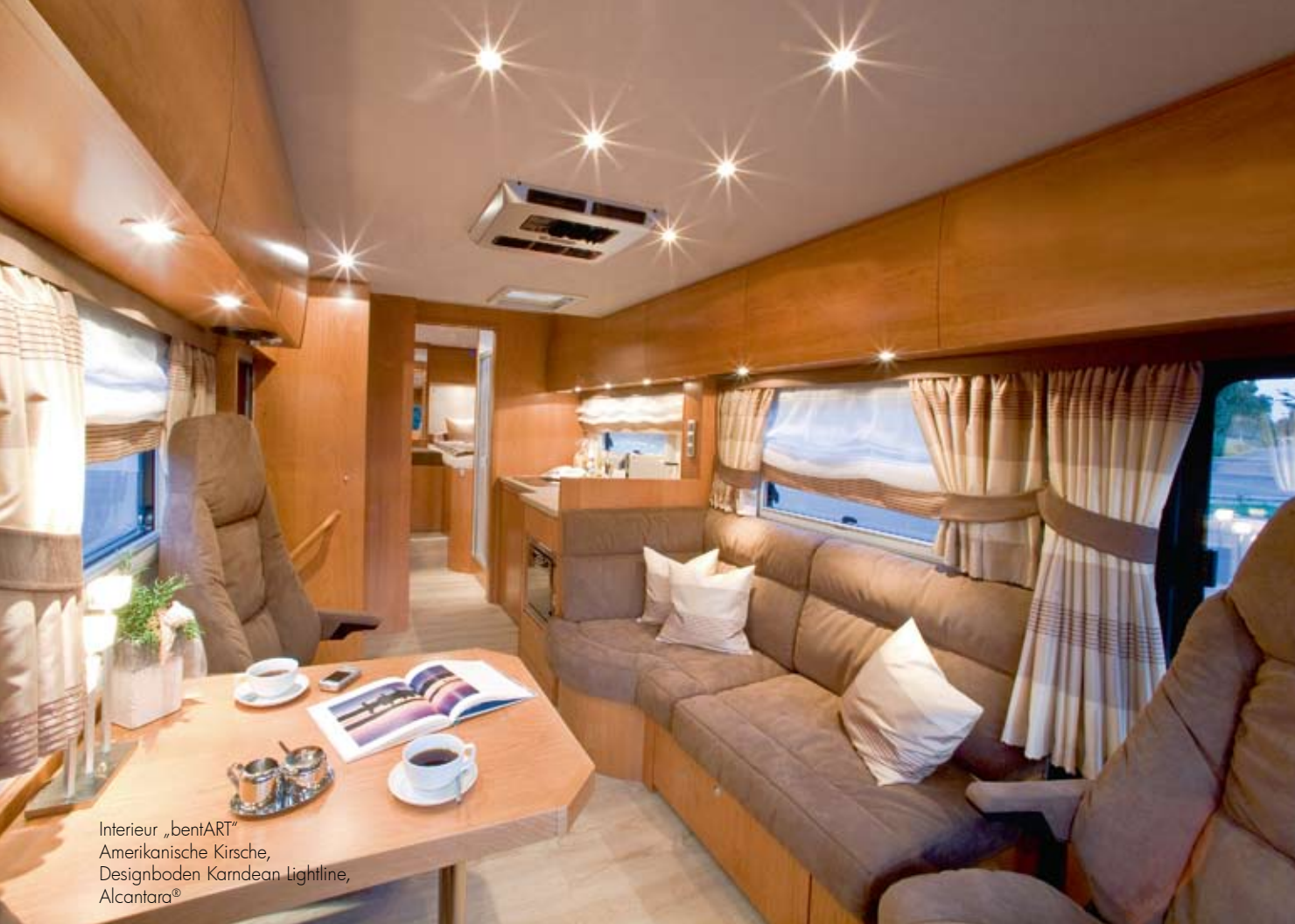
Interieur „bentART“ Amerikanische Kirsche, Designboden Kardean Lightline, Alcantara®