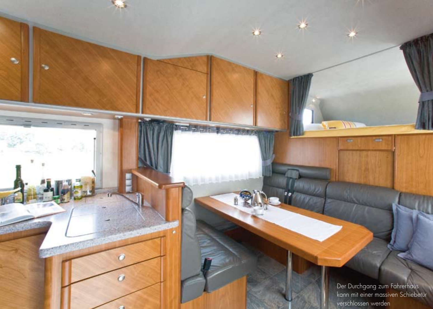
Der Durchgang zum Fahrerhaus kann mit einer massiven Schiebetür verschlossen werden