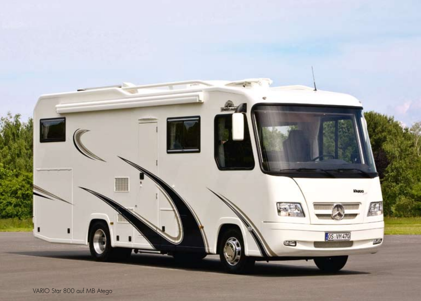
VARIO Star 800 auf MB Atego