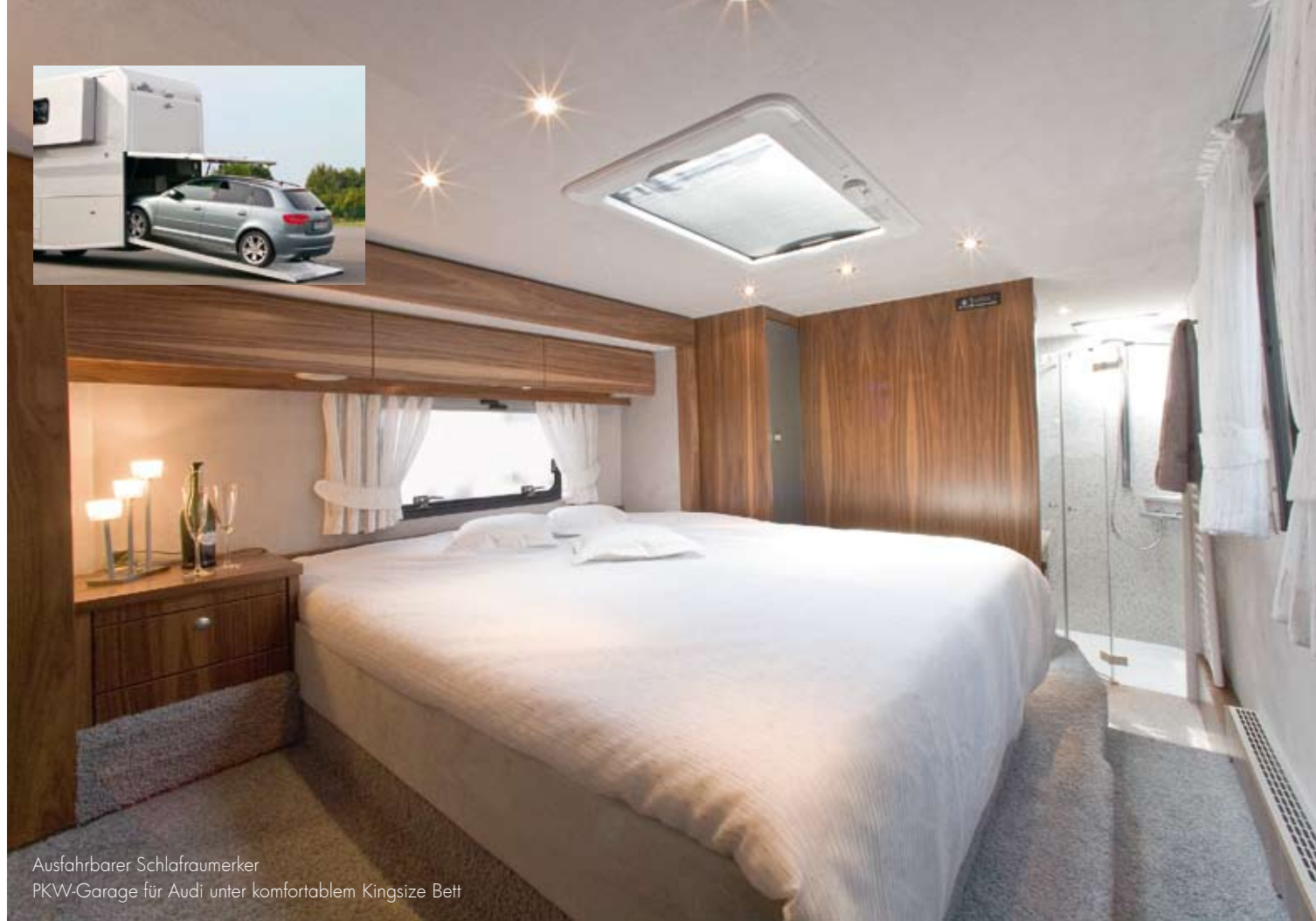
Ausfahrbarer Schlafamerker PKW-Garage für Audi unter komfortablem Kingsize Bett