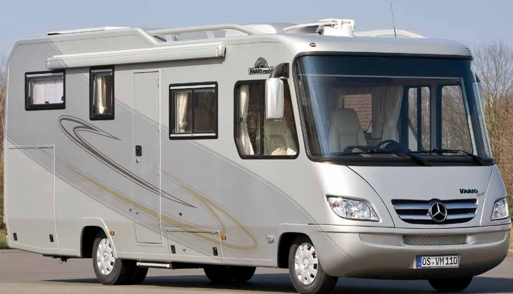
VARIO Star 750 auf MB Sprinter