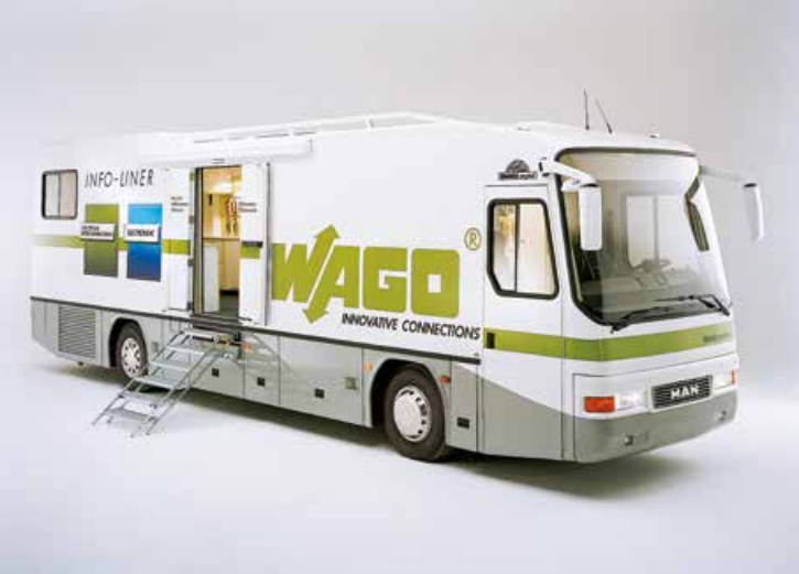
VARIO 1100 TI - MAN TGS