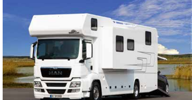
VARIO Alkoven 1050 - MAN TGS 18.440