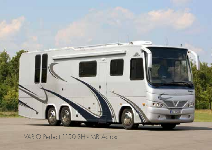
VARIO Perfect 1150 SH - MB Actros