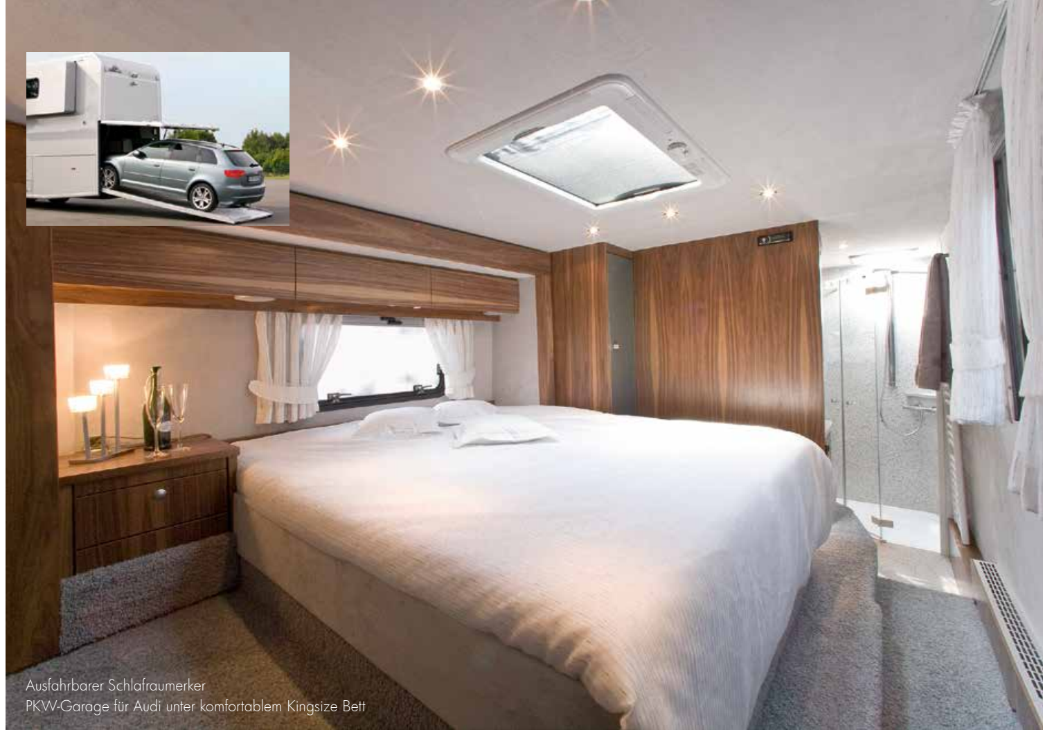
Ausfahrbarer Schlafraumerker PKW-Garage für Audi unter komfortablem Kingsize Bett