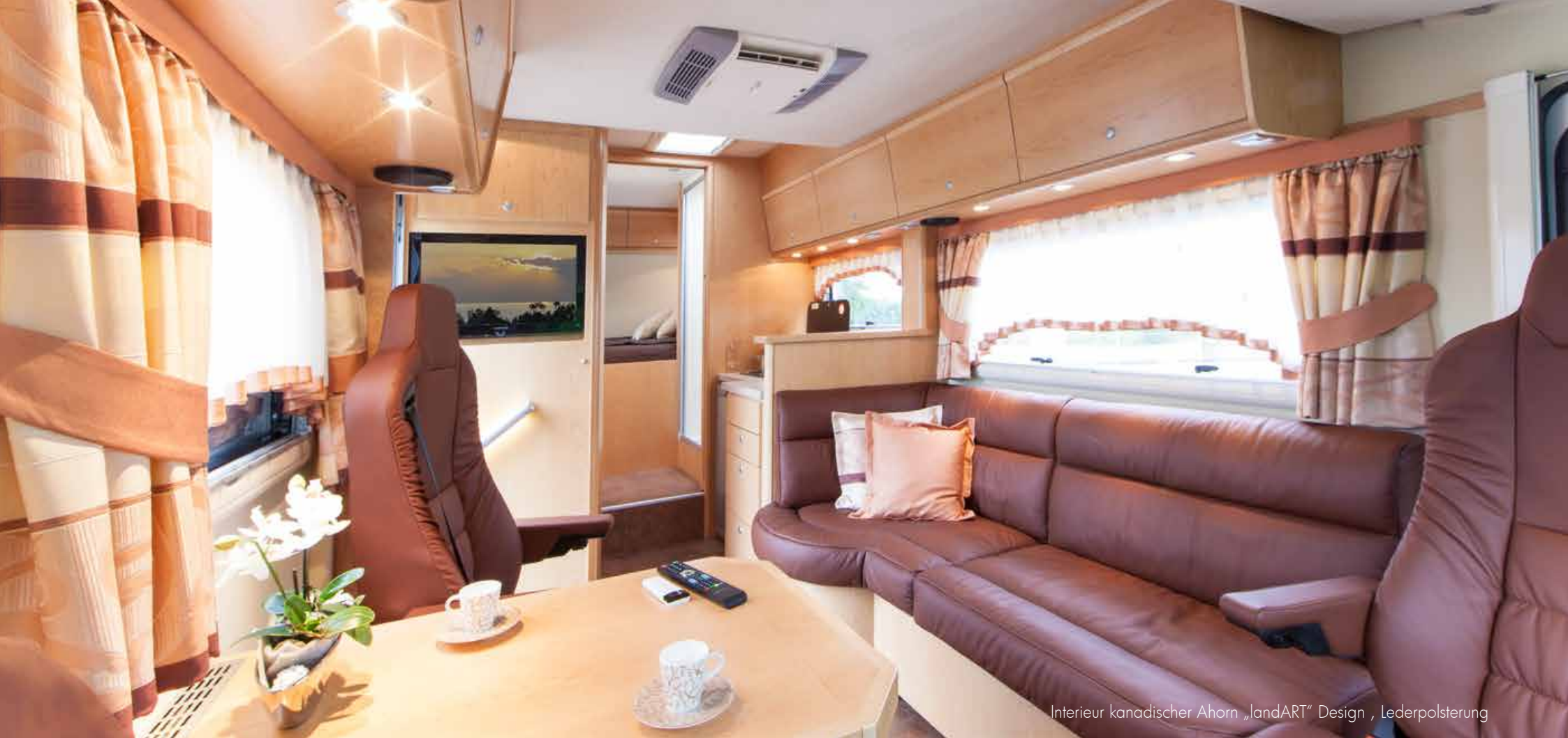
Interieur kanadischer Ahorn „landART“ Design , Lederpolsterung