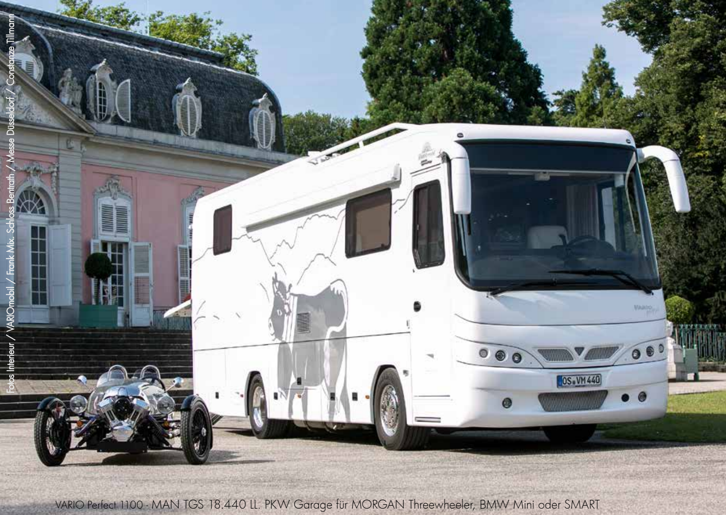
VARIO Perfect 1100 - MAN TGS 18.440 LL. PKW Garage für MORGAN Threewheeler, BMW Mini oder SMART