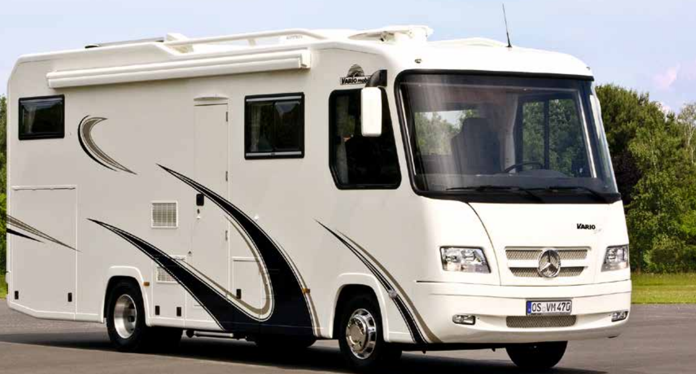
VARIO Star 800 auf MB Atego