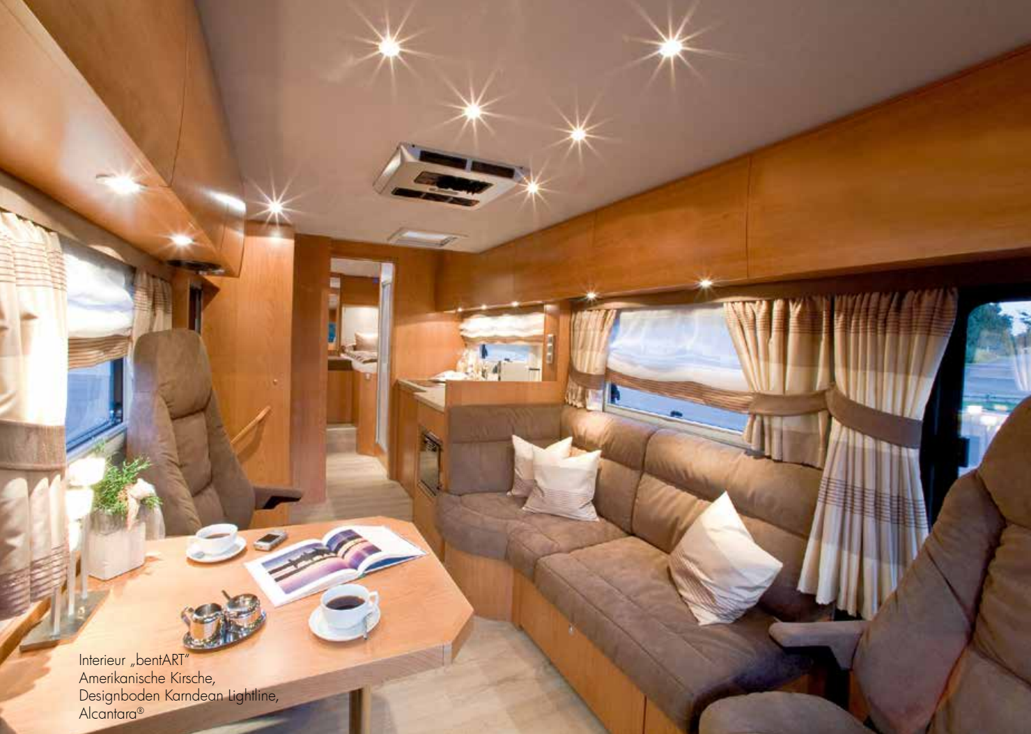
Interieur „bentART“ Amerikanische Kirsche, Designboden Kardean Lightline, Alcantara®