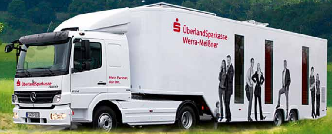
Sattelaufleger VARIO Dynamic - MB Atego - mobile Bankfiliale