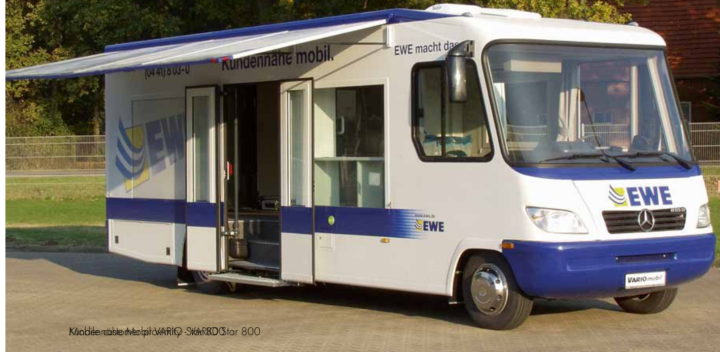
Kundennähe mobil. EWE macht das... VARIO mobil