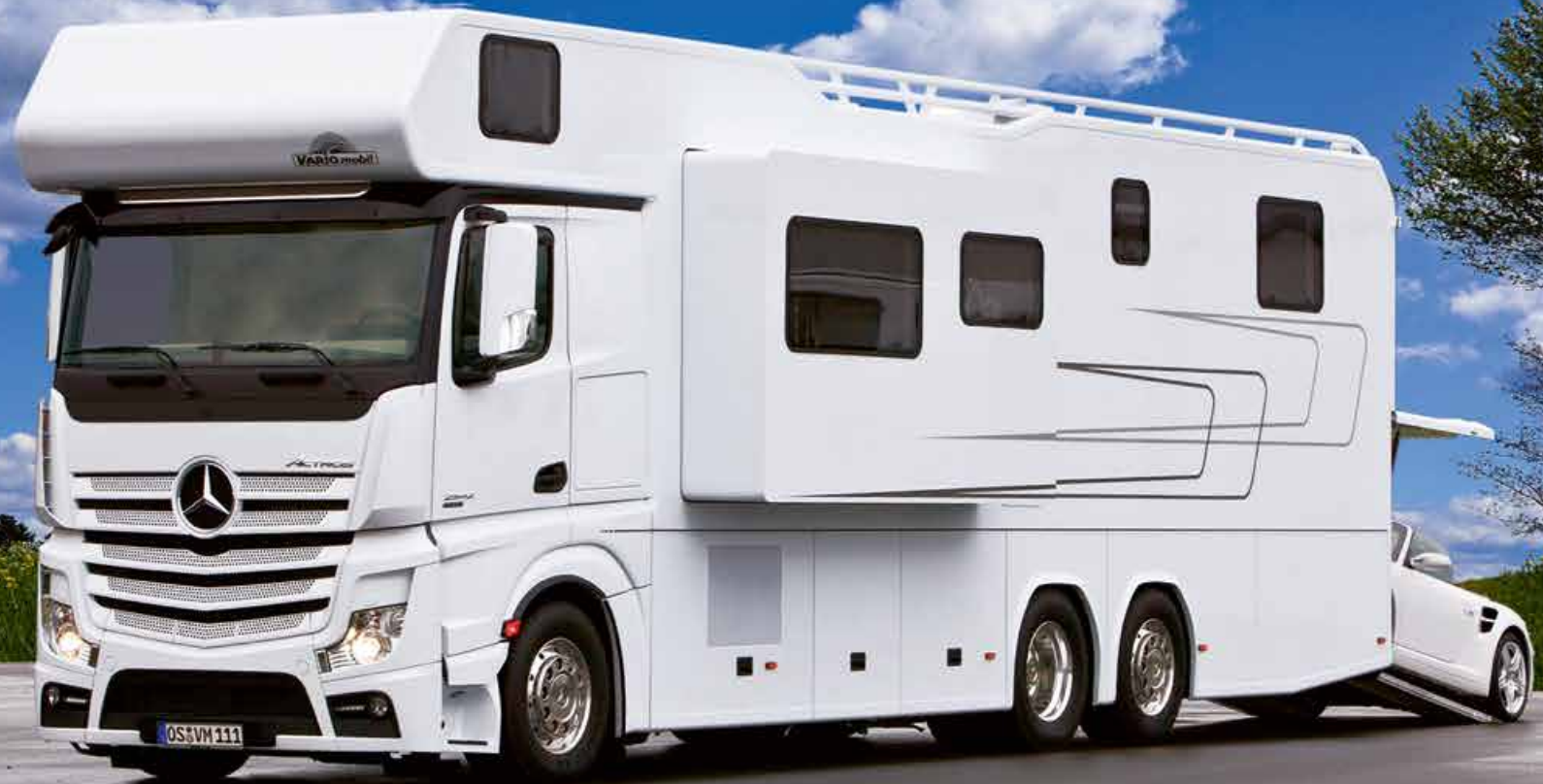
VARIO Alkoven 1200 - MB Actros 2543 LLL mit ausfahrbarem Wohnraumerker und PKW-Garage

Das innovativ gestaltete Fahrerhaus mit insgesamt vier Sitzplätzen unter dem klappbaren Alkovenbett verschmilzt durch einen extragroßen Durchgangsbereich optisch mit der großzügigen Wohnlandschaft – ähnlich wie bei einem integrierten Reisemobil.