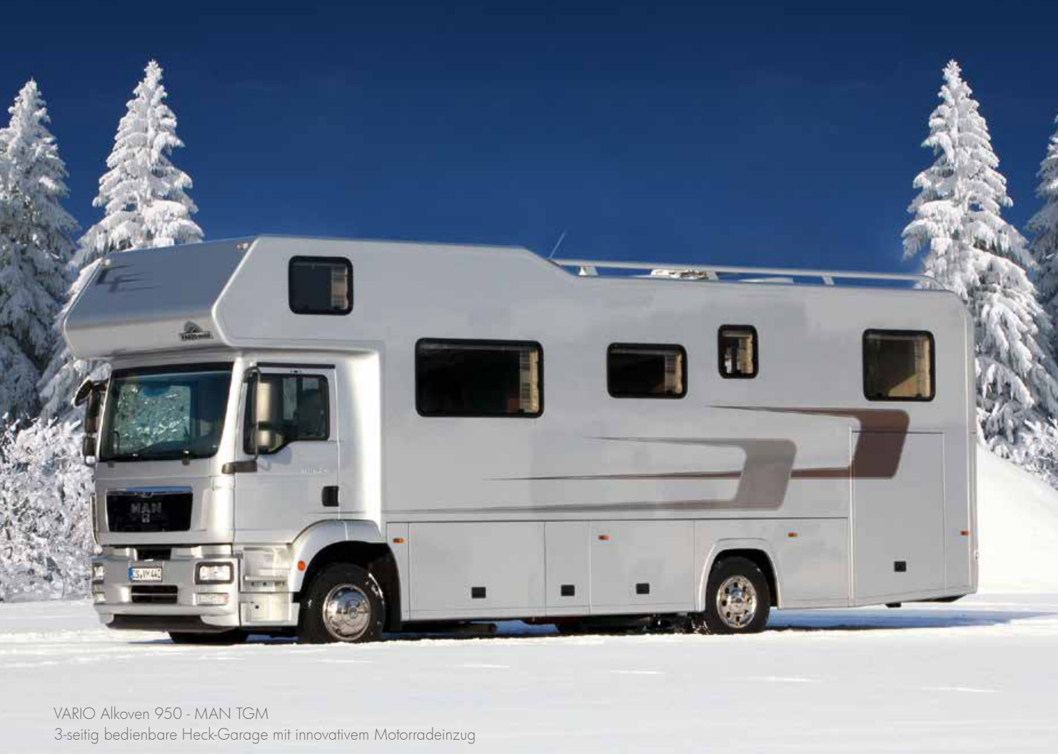
VARIO Alkoven 950 - MAN TGM 3-seitig bedienbare Heck-Garage mit innovativem Motorradeinzug