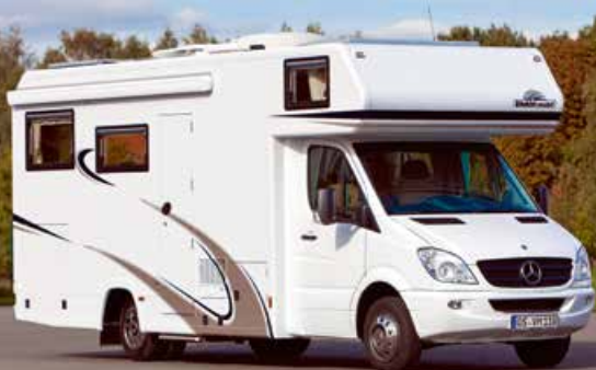
VARIO Alkoven 750 - MB Sprinter 519 CDI