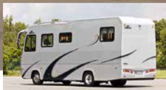
VARIO Perfect 850 SH - MAN TGL