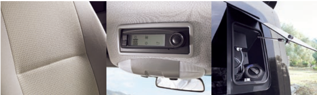
Der helle, doch pflegeleichte Stoffbezug „Salta“ ist extrem robust und strapazierfähig und sorgt für eine helle und freundliche Wohnatmosphäre.

wünsche verwirklichen. Anregungen und passendes Zubehör dazu finden Sie auf dieser Seite sowie unter www.westfalia-van.de . Oder lassen Sie sich fachkundig beraten – Ihr Westfalia Vertragshändler informiert Sie gern!