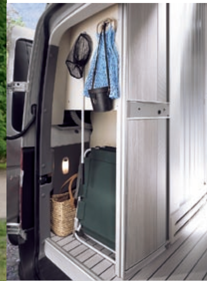
Pfiffige Stauraumlösungen wie der geräumige Heckschrank bieten großzügig Platz für Gepäck und Utensilien.

Abends wird das Bett im Dachausbau durch das bewährte Schlittensystem zum komfortablen Doppelbett. Und der Bereich der Doppelsitzbank verwandelt sich im Handumdrehen zum bequemen Nachtlager. Der neue, patentierte Klappmechanismus sorgt dabei für einfache Handhabung und für eine komfortable Liegefläche.