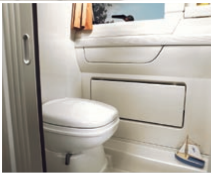
Für wohlige Wärme sorgt eine eigene Heizung, die für das Badezimmer individuell geregelt werden kann.

Der Sanitärraum überzeugt durch seine freundliche Atmosphäre mit integriertem Spiegelschrank, Ausstellseitenfenster mit Moskitonetz und Gardine sowie mit seiner praktischen und hochwertigen Innenausstattung.