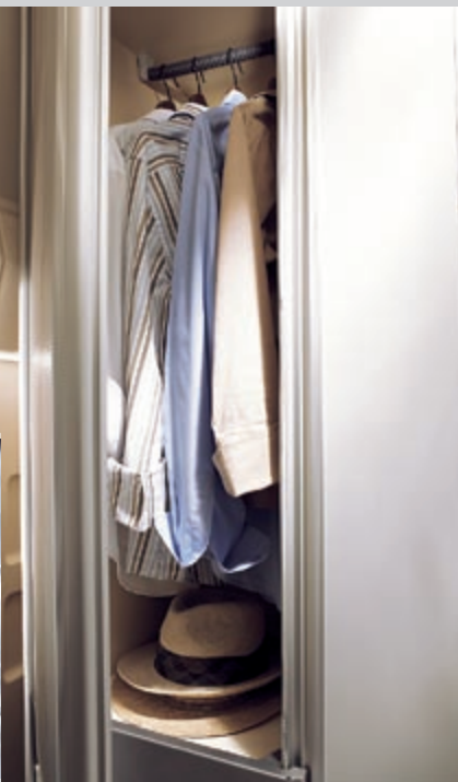
So komfortabel wie im Hotel: Großzügige Stauräume im Heckbereich bieten viel Platz. Hier ist Ihre Garderobe bestens und vor allem knitterfrei aufgehoben.