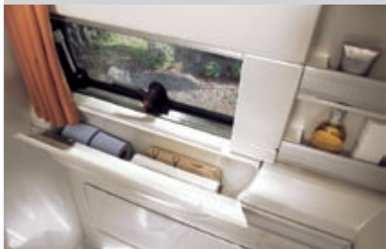
Großzügige Ablagen mit Reling bieten Ihnen ausreichend Platz für alle Utensilien.

Es sind nahezu alle Lackierungen möglich, die auch für den Mercedes Sprinter bestellbar sind. Bitte fragen Sie Ihren Westfalia-Händler.