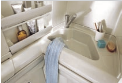
Waschbecken, Duschwanne, Kassettentoilette sowie die Seitenwandverkleidungen sind aus hochwertigen Kunststoffen gefertigt und somit bequem zu reinigen. Glas- und Aluminiumelemente setzen hochwertige Akzente.