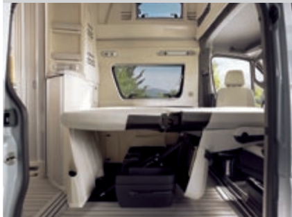
Die einteilige Sitzbank bietet zwei Personen bequem Platz und wird im Nu zum Doppelbett: Fahrer und Beifahrersitz um 90° drehen, Sitzbank entriegeln, Rückenlehne umklappen, Polster herunterklappen – fertig!