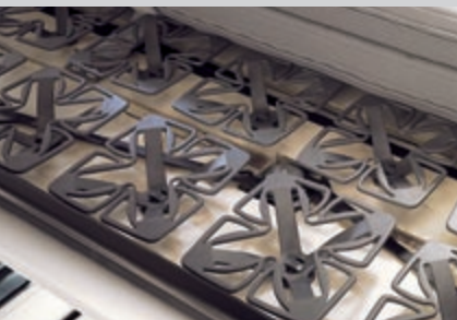
Für gesunden und erholsamen Schlaf sind alle Betten auf Federelementen gelagert. Diese ermöglichen zudem ein ausgeglichenes Schlafklima durch ausreichende Luftzirkulation unterhalb der Matratze.