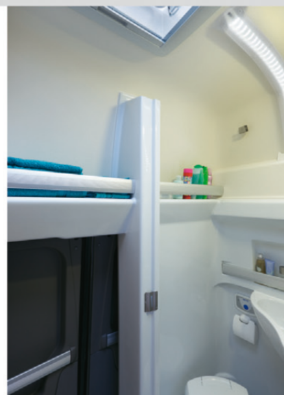
Neben bewährter Ausstattung bietet der Badbereich neue Details: mehr Stauraum durch die Ablage hinter der Hecktür sowie helle und stromsparende LED-Decken-Beleuchtung (SA). Aus der verschiebbaren Sitzbank wird in Sekunden ein großes Doppelbett.

Seit mehr als 50 Jahren steht Westfalia als Traditionsunternehmen für Reisemobile und Freizeitfahrzeuge der besonderen Art – nicht zuletzt dank der kompromisslosen Qualität, der Haltbarkeit, Alltagstauglichkeit und vor allem der Sicherheit. Diese Vorzüge nutzen auch namhafte Automobilhersteller wie Fiat, Mercedes Benz, Ford und Opel seit Jahrzehnten – Marken, mit denen Westfalia einige der beliebtesten Reisemobile der letzten Jahrzehnte entwickelt hat. Fachkreise und Kunden honorieren dies regelmäßig mit zahlreichen Auszeichnungen zum „Reisemobil des Jahres“. Auch die von Westfalia produzierten Modelle „Marco Polo“, „Nugget“ und „Vivaro Life“ sind aus dem Straßenbild von heute nicht wegzudenken.