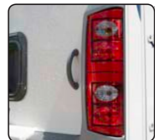
Pilotos traseros + 3ª luz de freno Fari posteriori + 3 stop