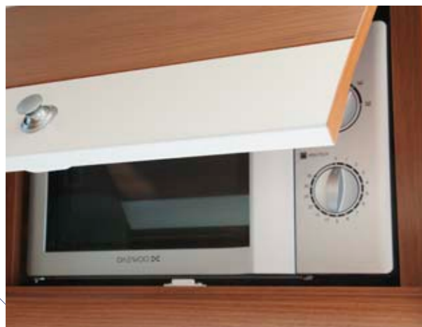
Venicia Premium 550