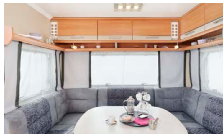
Allegra 450 "Stone"