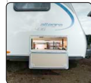
Portón exterior (excepto) Portellone esterno (eccetto)