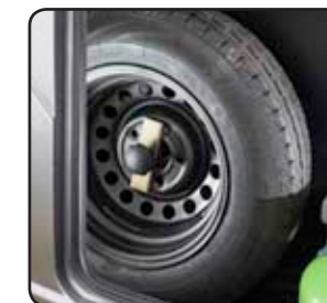
Rueda de recambio ruota di scorta