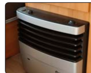
Calefacción de gas TRUMA Stufa TRUMA