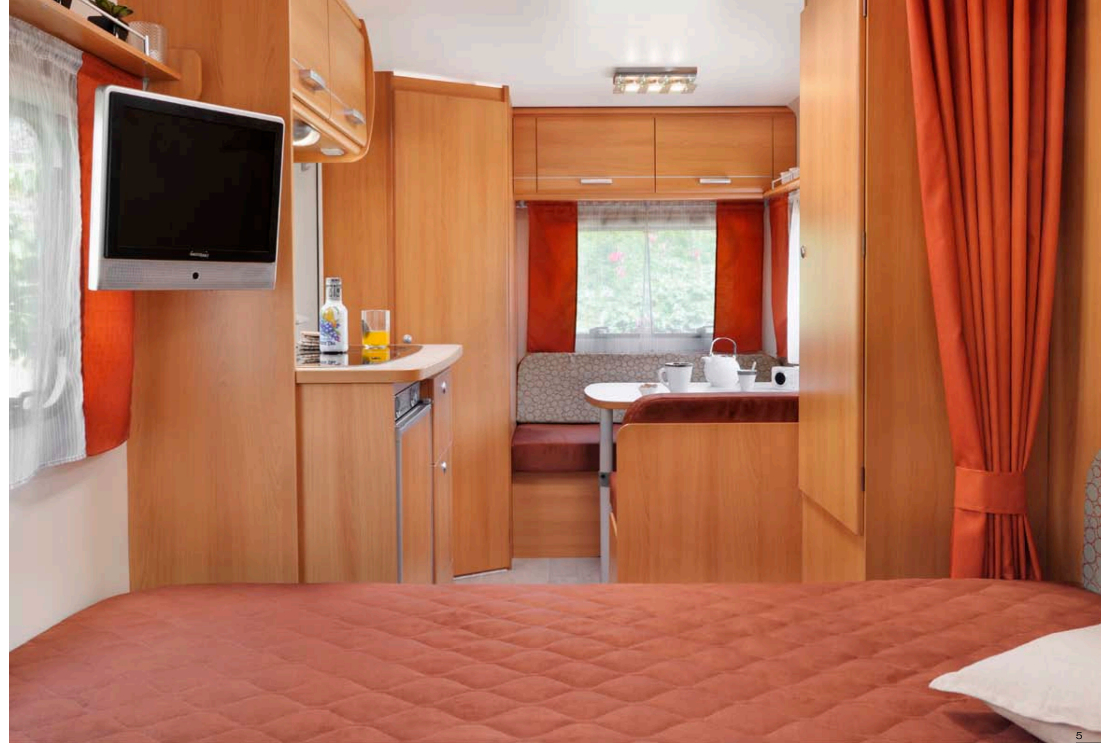
Antarès Luxe 390 "Florestan"