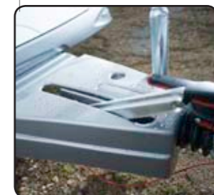
Protector lanza (opcional) Copri timone (optional)