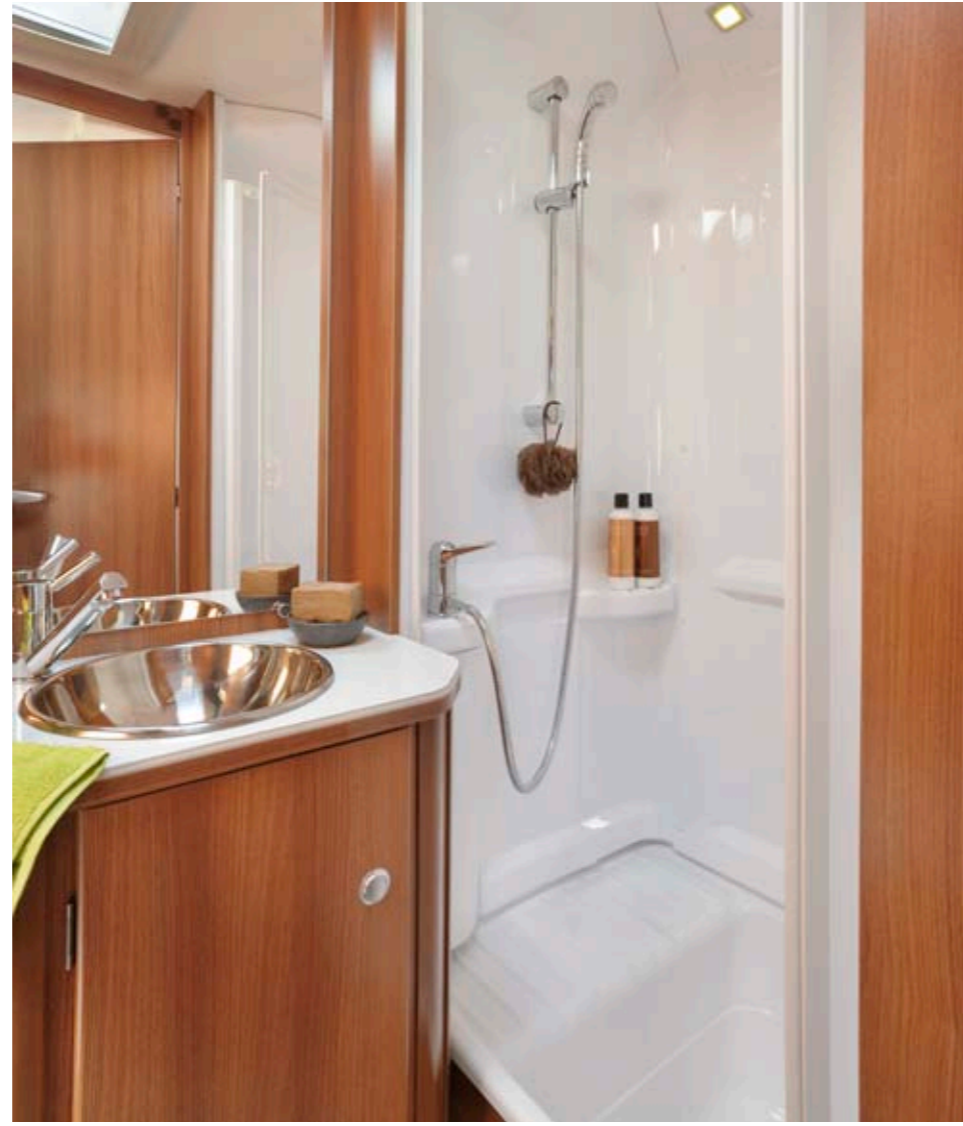
Venicia Premium 550