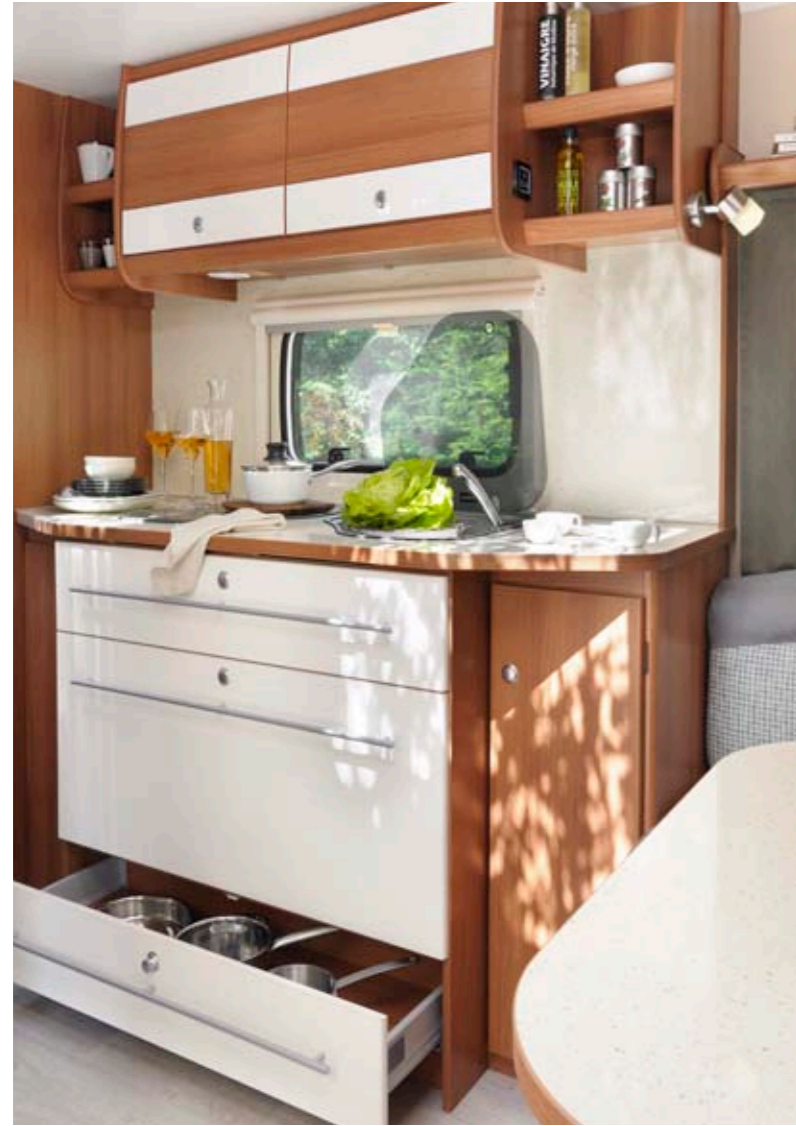
Venicia Premium 480