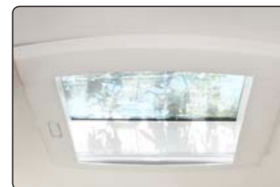
Claraboya panorámica Øblo panoramico