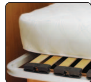
Colchón de alta densidad + somier de láminas Materasso alta densità rete a doghe