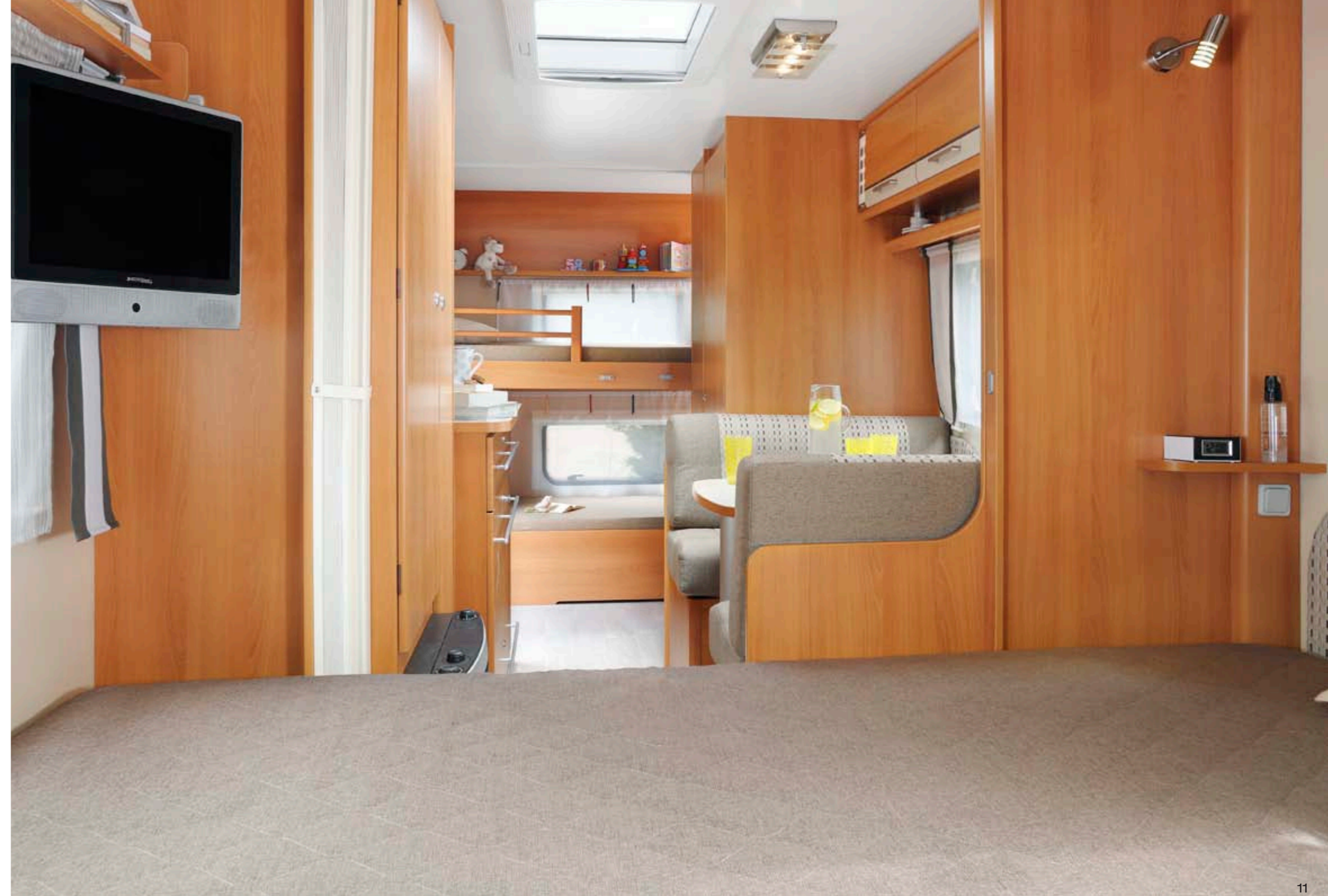
Allegra 486 "Bolzio"