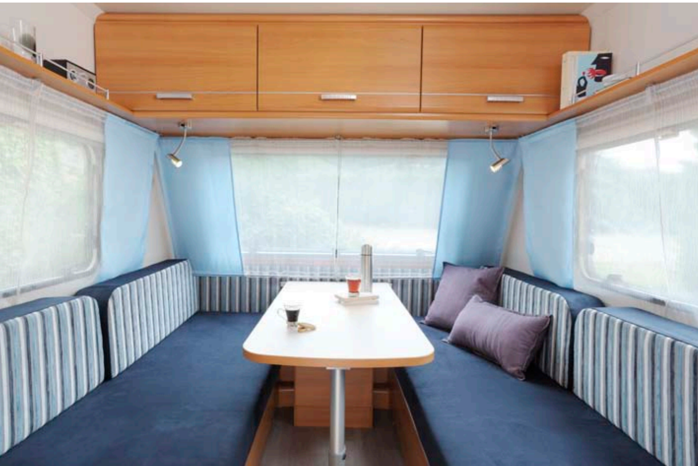
Antarès Luxe 372 "Ocean"