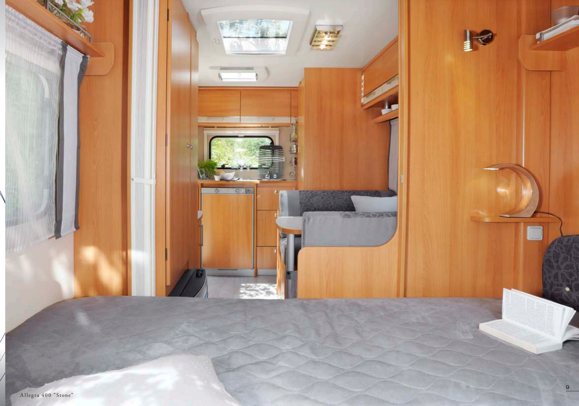
Allegra 400 "Stone"

+ Confort interior Comfort degli interni