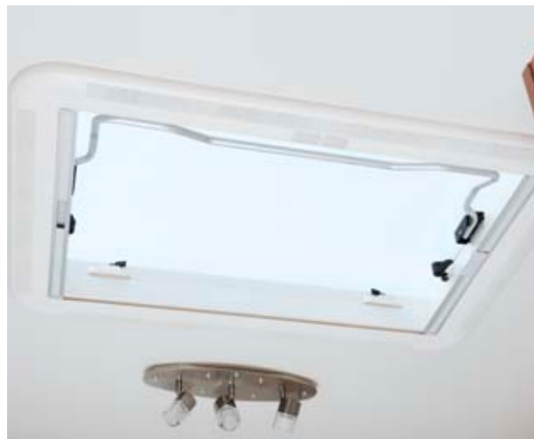
Venicia Premium 550