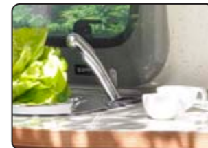
Calentador de agua Boiler