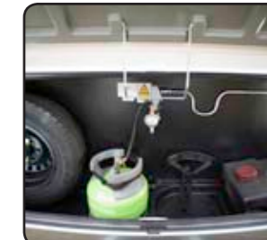
Cofre para bombona de gas Gavone porta bombole