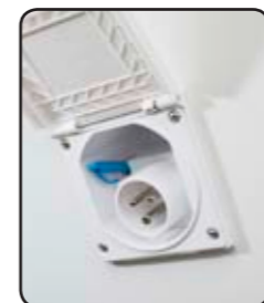
Toma exterior (P17) Presa esterna (P17)