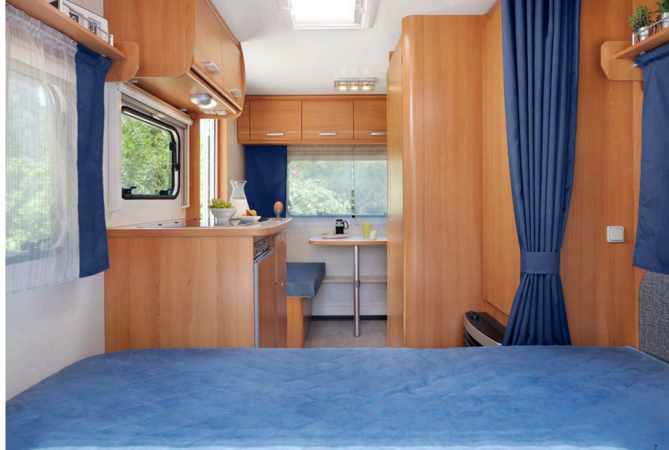
Antarès Luxe 380 "Denim"

* Tapicerías opcionales con coste suplementario / Opzione a pagamento