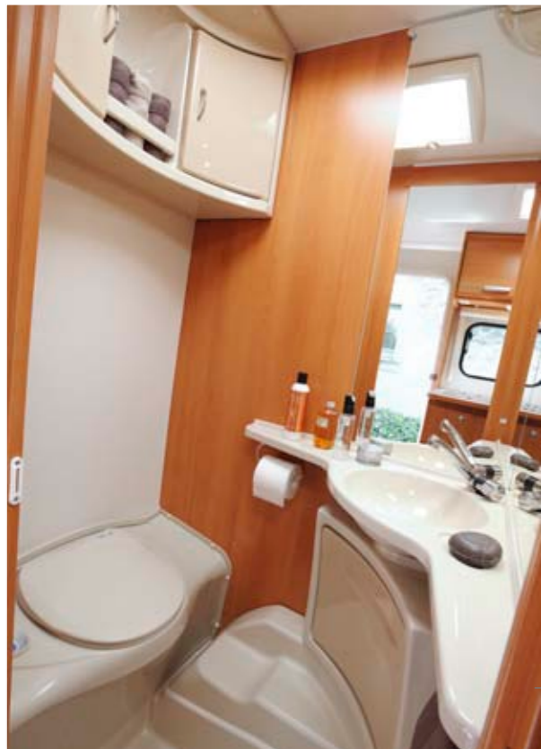
Antarès Luxe 380