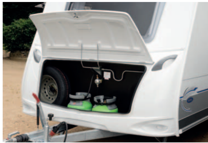
Cofre delantero de gran capacidad Portapacchi anteriore di grande capacità