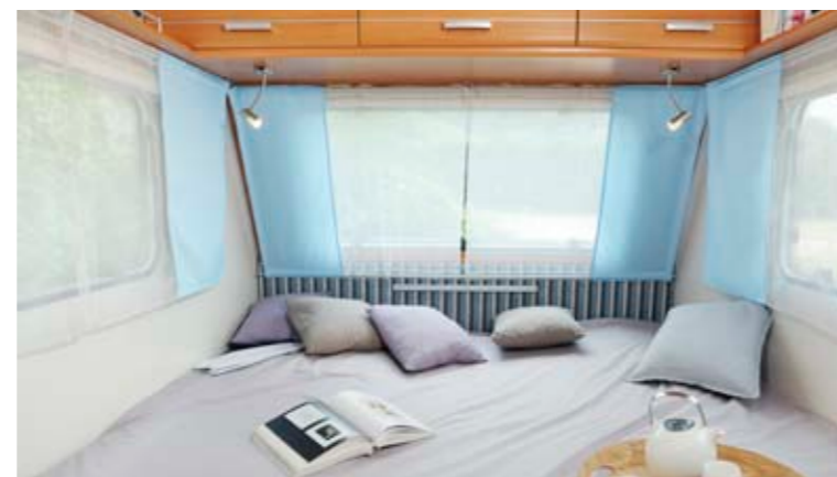
Antarès Luxe 372 "Ocean"