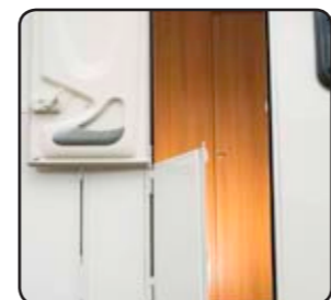
Puerta de dos hoja Porta doppia battente