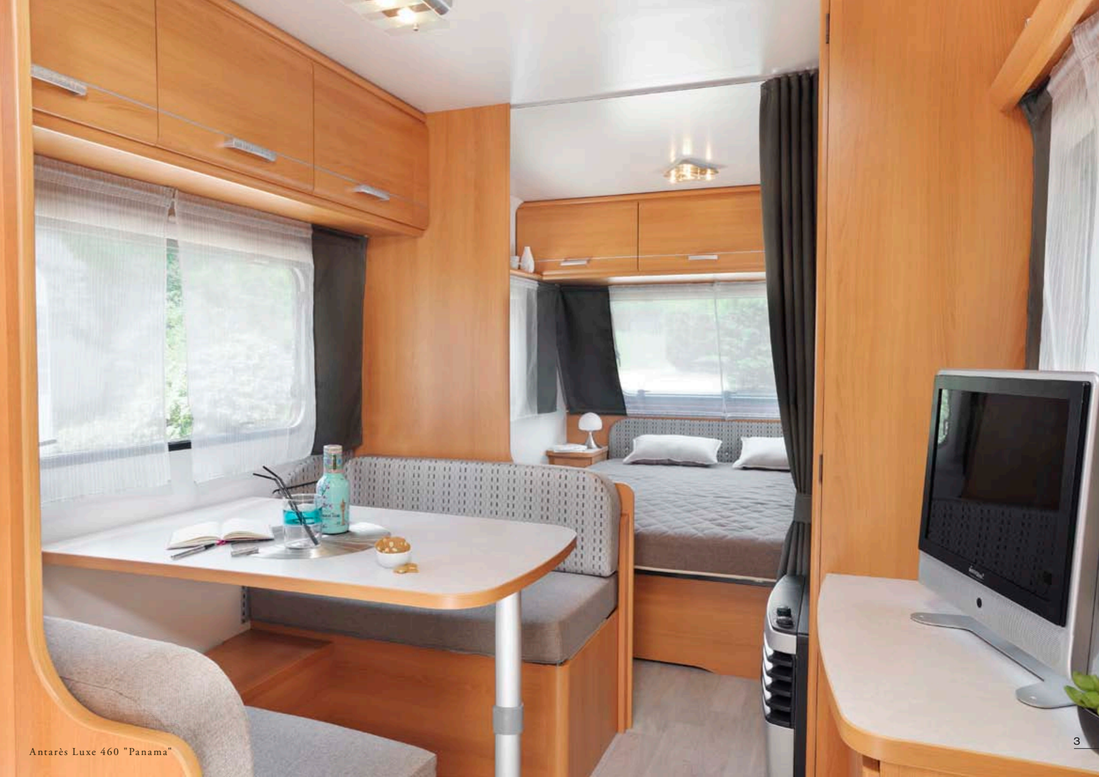
Antarès Luxe 460 "Panama"