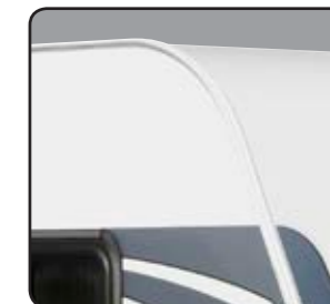
Paredes y techo poliéster antigranizo Parete e tetto poliestere anti-grandine