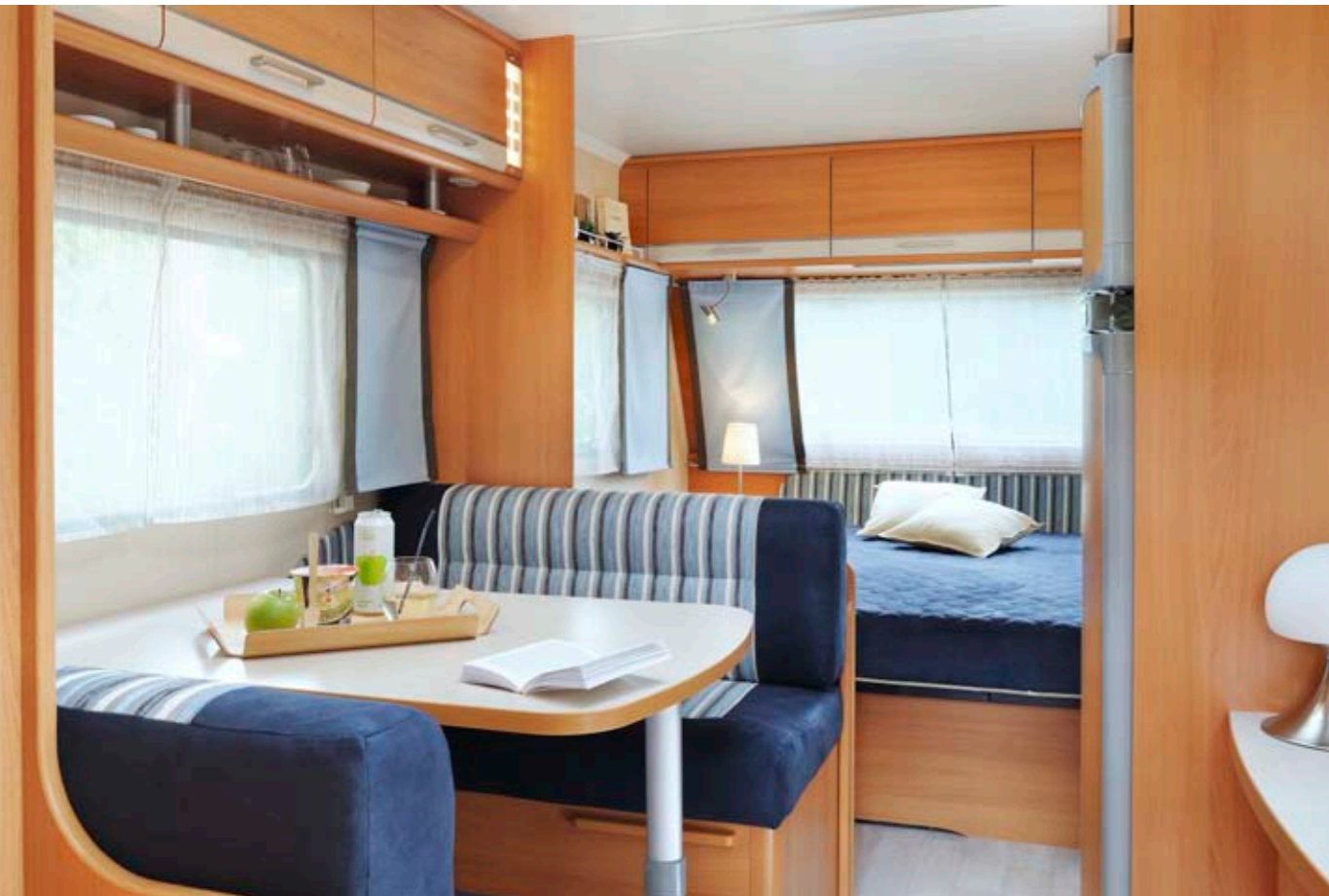
Allegra 485 "Azur"