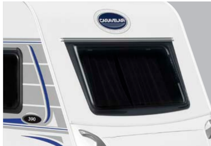
Techo de poliéster liso con desarrollo hasta el cofre delantero Tetto in poliester liscio ininterrotto fino al portapacchi anteriore