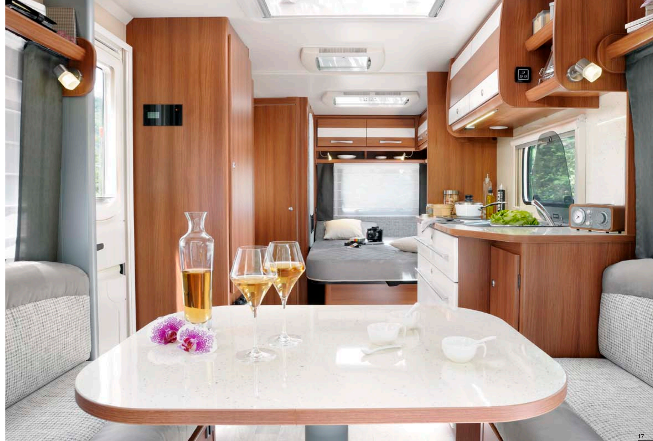
Venicia Premium 480 "Teramo"