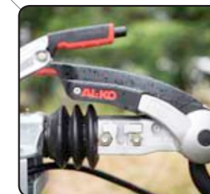
Estabilizador AKS AKS : anti sbandamento