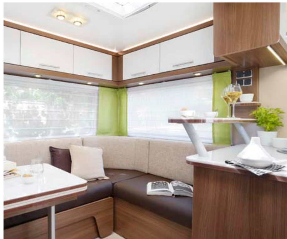
Serenity 500 "Capucino"