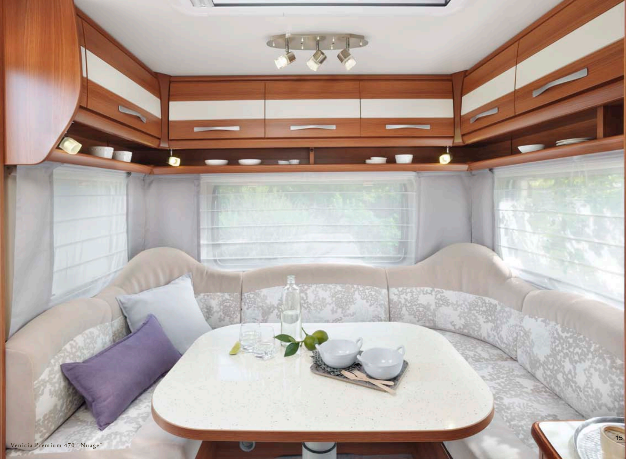
Venicia Premium 470 "Nuage"