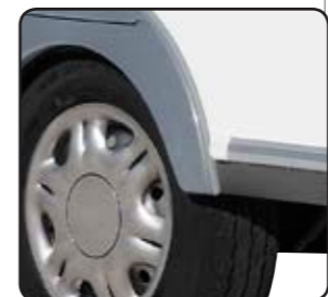
Eje ALKO + amortiguadore Talaio Alko + Ammortizzatori