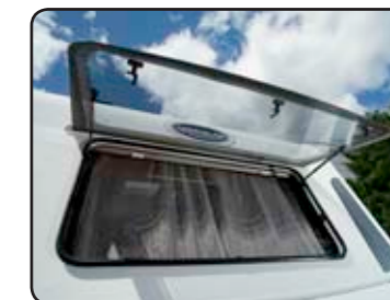
Todas las ventanas abatibles + delantera panorámica, con conjunto oscurecedor/mosquitera Tutte le finestre sono apribili + finestrone anteriore panoramico combinato di oscurante e zanzariera