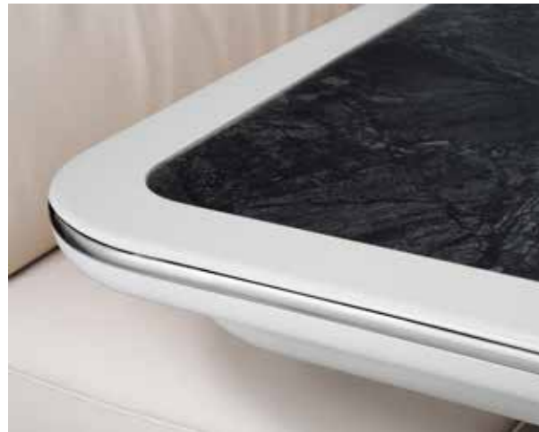
Tischplatte „Schiefer“ mit Randleiste in Vanille