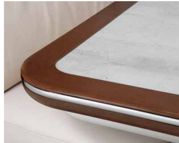
Tischplatte „Marmor“ mit Randleiste in Macadamia