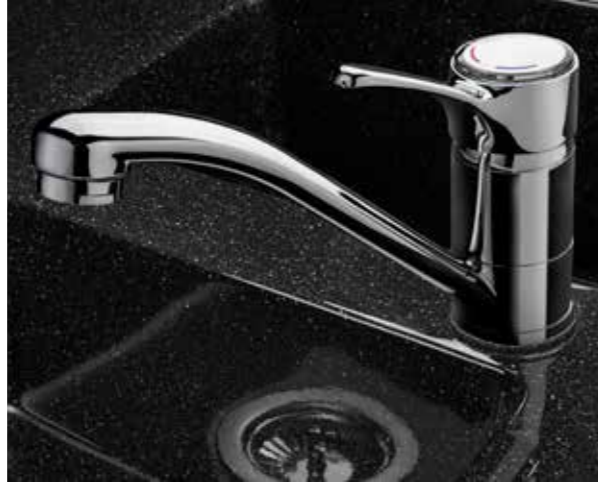
Morelosan Pepper (optional)

Beim Wohnraumbereich haben Sie die Wahl zwischen drei verschiedenen Dekoren mit Randleisten entweder in „Vanille“ oder „Macadamia“ und strapazierfähigen, kratzunempfindlichen Schichtstoffoberflächen. Die Arbeitsplatte in der Küche bietet drei Dekorvarianten und optional eine hochwertige Morelosan-Oberfläche. Spül- und Restbecken sind nahtlos eingepasst, die Arbeitsplatte lässt sich so sehr leicht und komfortabel reinigen.