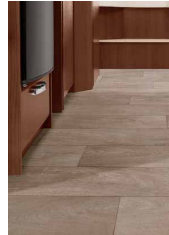
□ Cappuccino (optional)