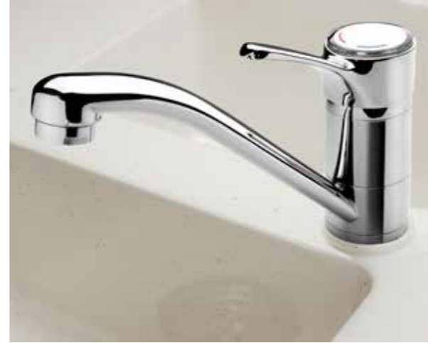
Morelosan Salt (optional)