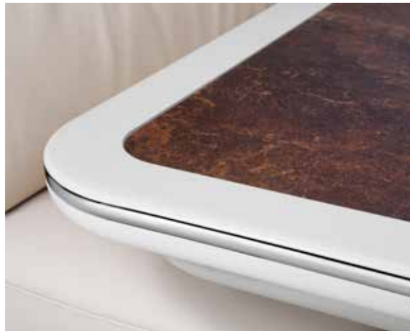
Tischplatte „Kupfer“ mit Randleiste in Vanille