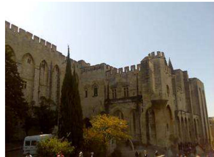
Cattedrale dei Doms