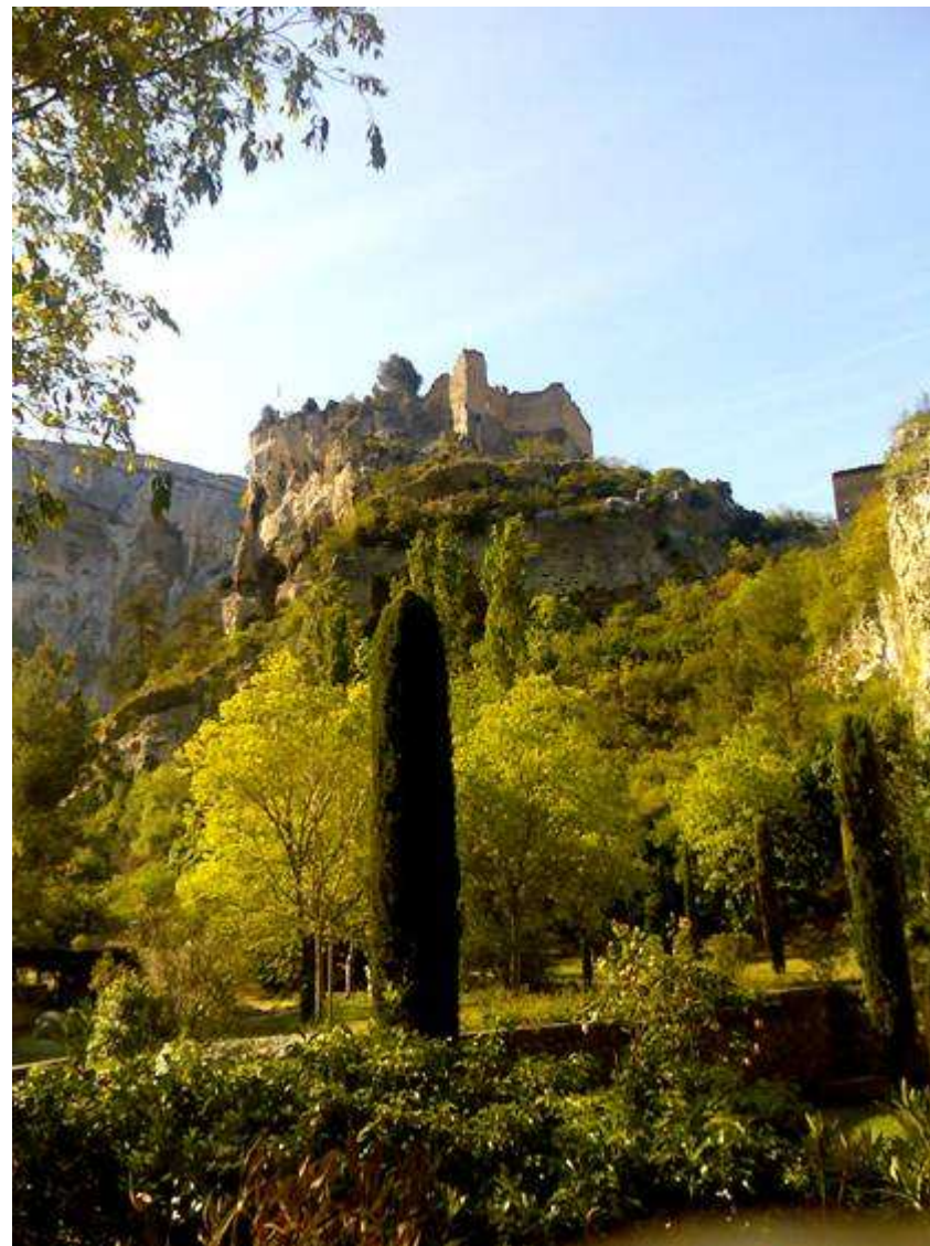
Le cascate della Vaucluse e le sorgenti viste dal giardino del museo