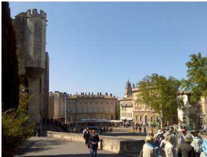
Torrione Merlato con vista sulla torre campanaria