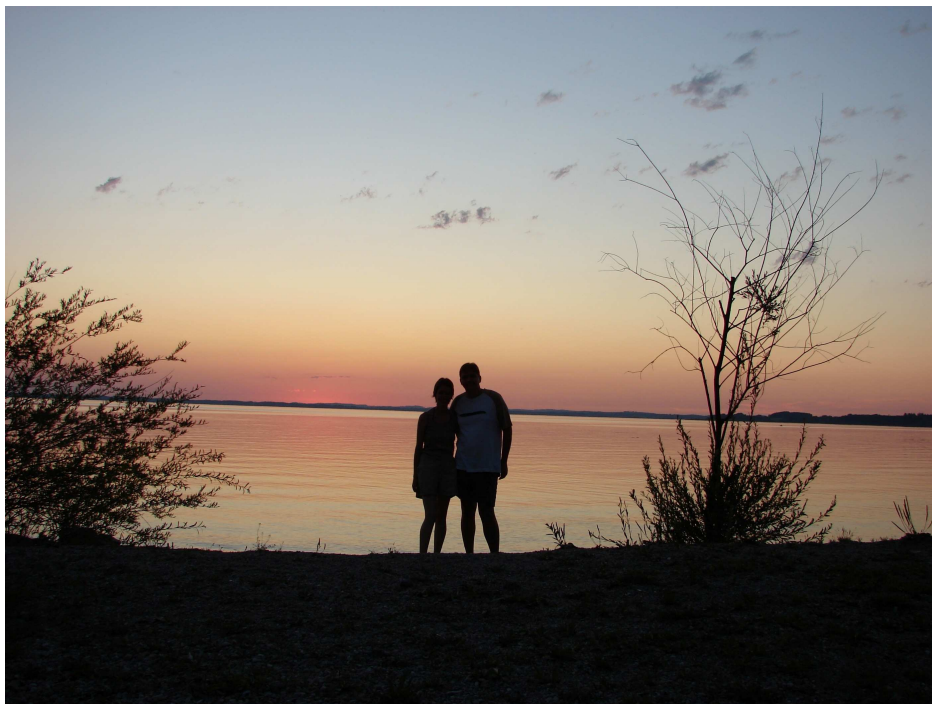
Figura 2 Tramonto sul Chiemsee

NB: all'uscita dell'autostrada a Felden, sponda ovest del lago, c'è un grande info-point con depliant anche in italiano su tutte le località del lago e le zone limitrofe e orari dei traghetti, con possibilità di navigare in internet gratuitamente per 15 minuti. L'ufficio merita davvero una visita!!