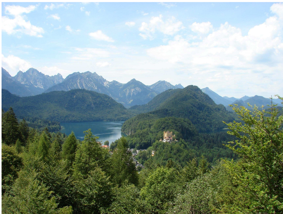
Figura 1 Hohenschwangau sullo sfondo delle Alpi

Partiamo presto col camper, lasciando il tavolino sgangherato ad occupare la piazzola. (I 6 km sono troppi per me in bici, ma fattibilissimi se si è un po' allenati!) e parcheggiamo nel parcheggio 4, il più vicino ai castelli (7 euro per tutta la giornata). Arrivando presto alle 8.30 non c'è coda alla biglietteria e otteniamo gli ingressi per le visite guidate a entrambi i castelli in mattinata, alle 9:55 Hohenschwangau e alle 11:55 Neuschwanstein . Dopo