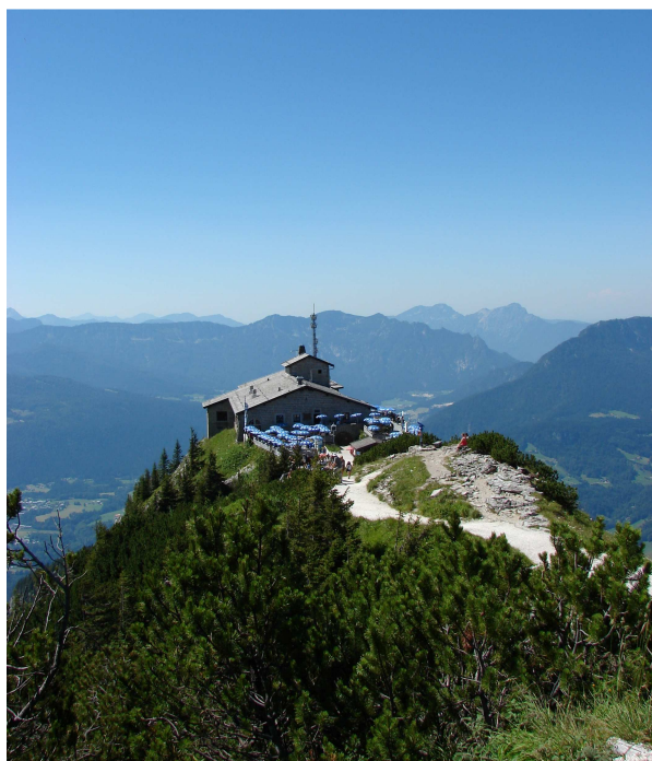
Figura 3 Il Nido dell'aquila sopra Berchtesgaden

Partiamo dal Chiemsee e ci dirigiamo a Berchtesgaden, per visitare il famoso rifugio di Hitler: Il Nido dell'Aquila. Prendiamo l'autostrada fino a Salisburgo Sud, dopo aver acquistato una Vignette valida 10 giorni, che useremo anche per il ritorno sulle autostrade austriache. Berchtesgaden dista solo una trentina di km da Salisburgo e una volta arrivati andiamo al centro informazioni, nella zona sud della città, a fianco della strada per il Konigsee. Qui ci facciamo spiegare come raggiungere Obersalzberg, l'area di parcheggio da dove partono gli autobus che portano al rifugio. Ci sono due strade che salgono ai parcheggi e una è vietata alle roulotte perché molto ripida, e ci viene infatti sconsigliata. Anche l'altra comunque ha belle pendenze, che ci costringono a salire in seconda e in alcuni tratti anche in prima!