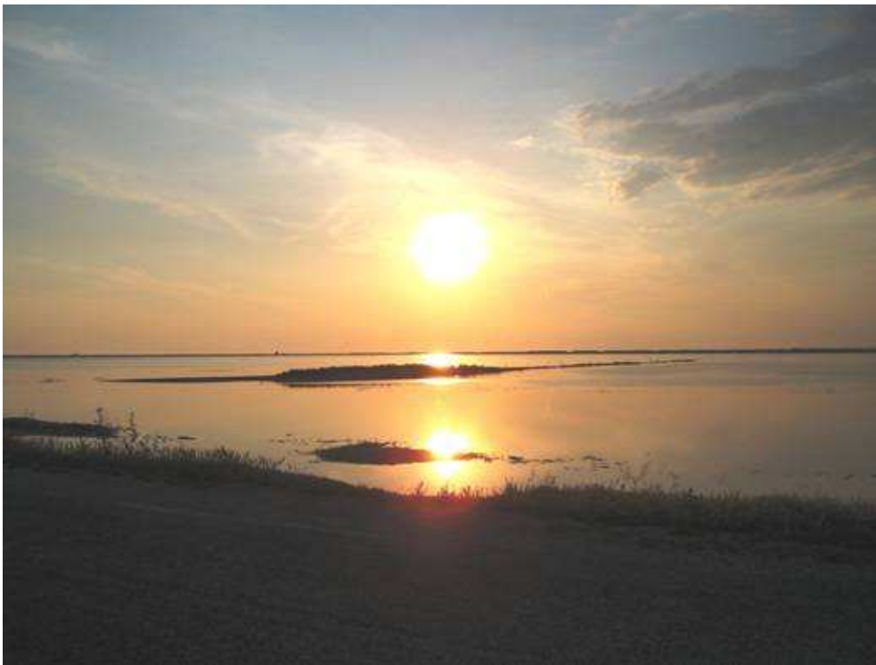
saline (Salin de Giraud)

Ingresso in autostrada a Galliate, quindi in successione Torino, Susa, Oulx, passo del Monginevro, Briançon, Gap, Sisteron, Aix en Provence, Martigues, e quindi in riva al Rodano di fronte a Salin de Giraud, prendiamo il traghettino BAC de BARCARIN, siamo quindi arrivati in Camargue, essendo ormai il tramonto ci dirigiamo alle saline quindi a la Plage di Piemançon per passare la notte direttamente sulla spiaggia (Minstral permettendo).