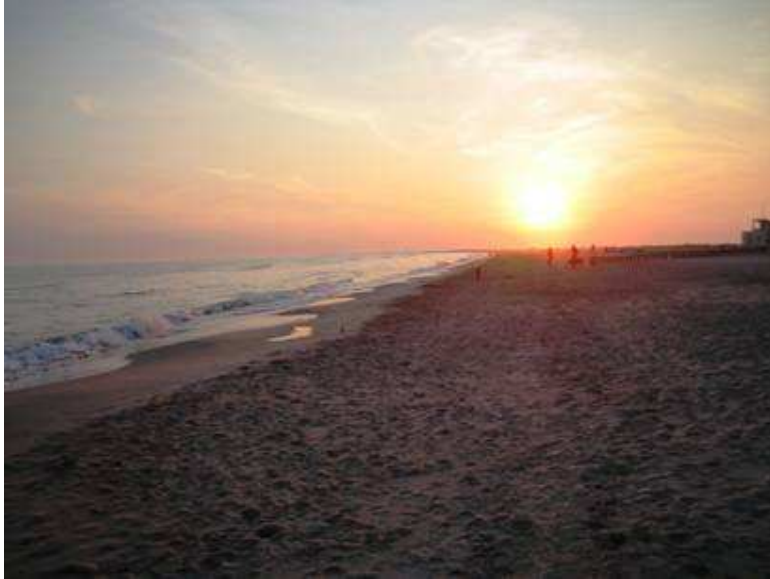
Plage di Piemancon