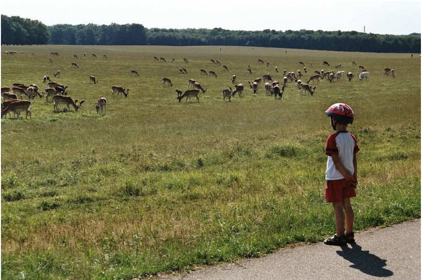
Un branco di cervi in libertà nel parco di Dyrehaven nei pressi di Copenhagen.

Ripartiamo con meta Copenhagen ma prima di arrivare alla capitale ci fermiamo per una visita al Klampenborg ; anche in tal caso inforchiamo le bici e facciamo un lunghissimo giro nel parco dei cervi Dyrehaven. Il parco è molto grande e veramente bello, all'inizio sembra un'eccezione riuscire a vedere un cervo ma un po' alla volta ci facciamo quasi l'abitudine. Forse chiediamo un po' troppo alla resistenza di Pietro che con la sua bicicletta pedala come un piccolo Bartali, resistendo fino alla fine del lungo percorso.