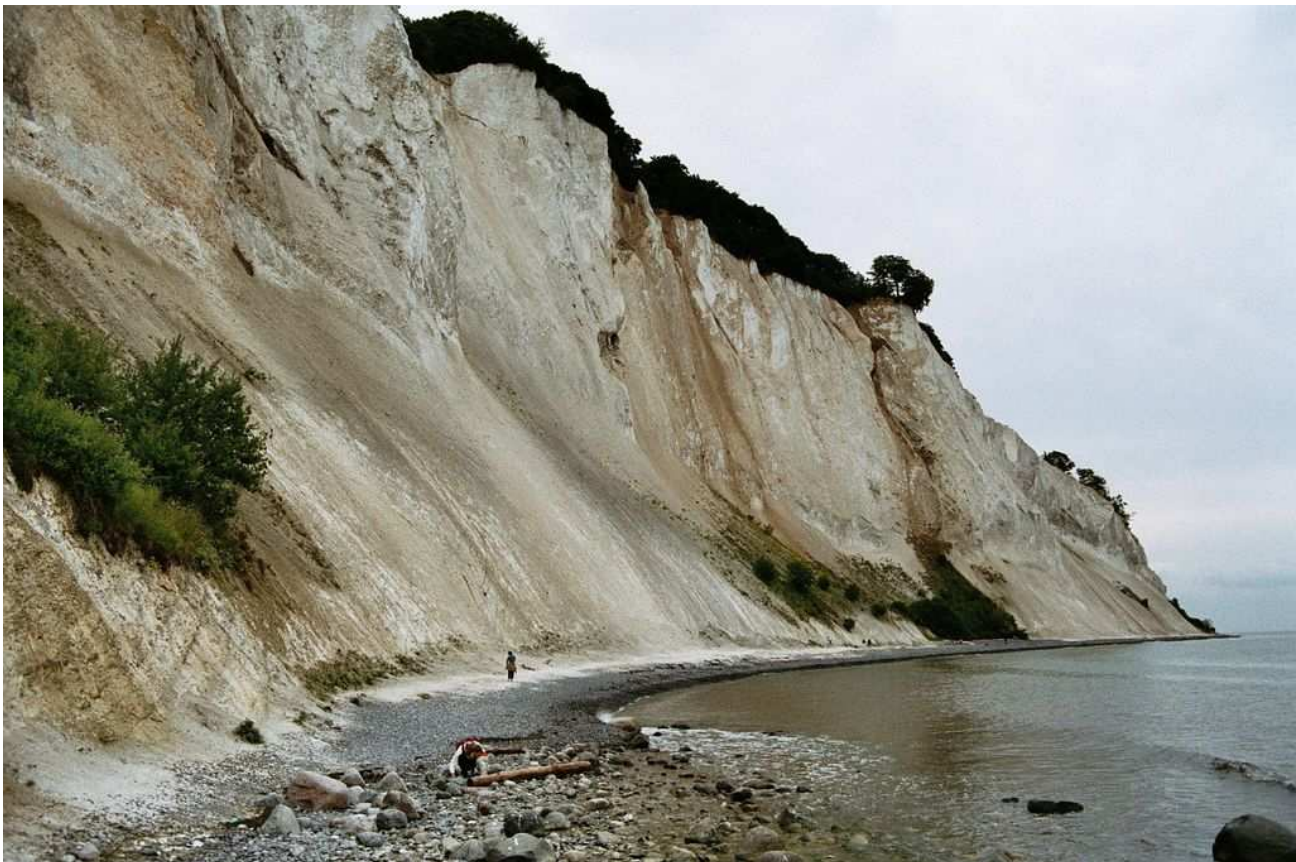
Le imponenti scogliere di Mons Klint.

Alle 10.30 arriviamo al parcheggio dove lasciamo il camper per scendere la lunga scalinata che porta alle famose scogliere di Mons Klint. A quest'ora non c'è quasi nessuno e parcheggiamo con facilità (25 Kr per il parcheggio) mentre alle 12 quando torniamo c'è un grande afflusso di gente. Mangiamo e quando ripartiamo verso le 13 è un dramma per chi deve parcheggiare. Non siamo stati molto fortunati perché la giornata un po' uggiosa non ci ha fatto apprezzare le bianche scogliere tanto rinomate.