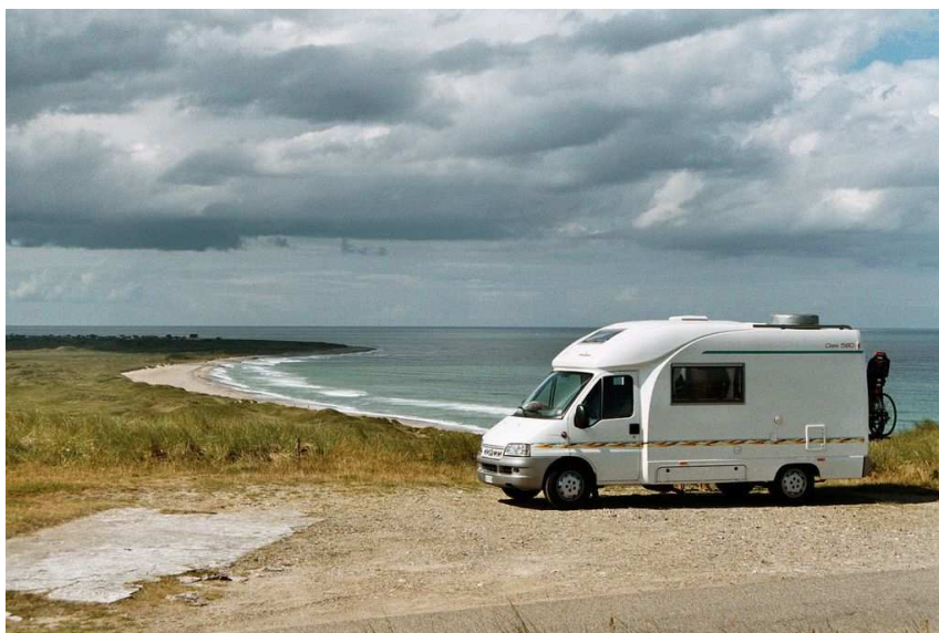
Paesaggio tipico della costa occidentale danese .

Da Fussen, Fernpass a Innsbruck con visita alla città, in serata rientriamo a casa senza problemi.