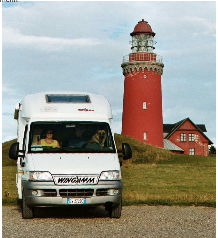
Visita ad uno dei numerosi fari della costa danese.

Da Billund raggiungiamo Arhus dove c'è il famoso Den Gamble By (80 Kr a persona, gratis bambini, Wolf può entrare) Si tratta di un museo all'aperto, sono stati ricostruiti edifici del 1600 fino ai primi del 900 provenienti da varie parti della Danimarca. E' stato ricreato un piccolo borgo con case, arredamenti originali e comparse in costume, molto interessante da vedere e piacevole anche per i piu' piccoli.