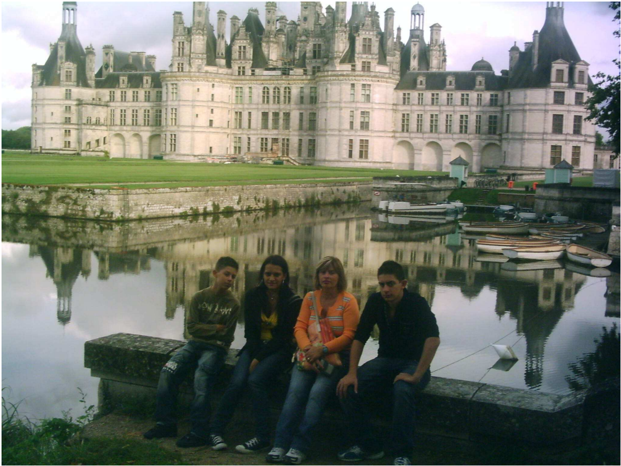
sotto il castello di Chenonceau e i giardini,