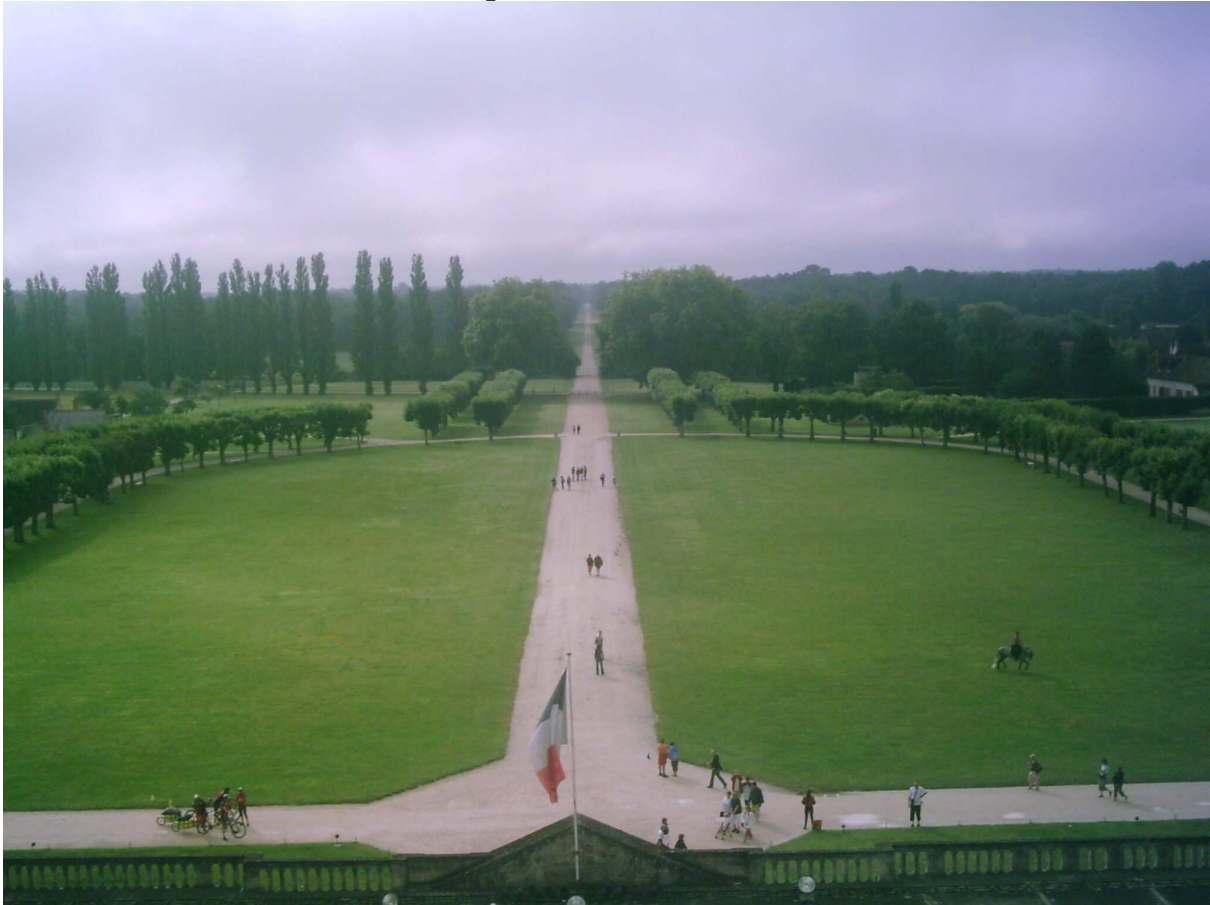
Alcune foto del castello di Chambord e giardini