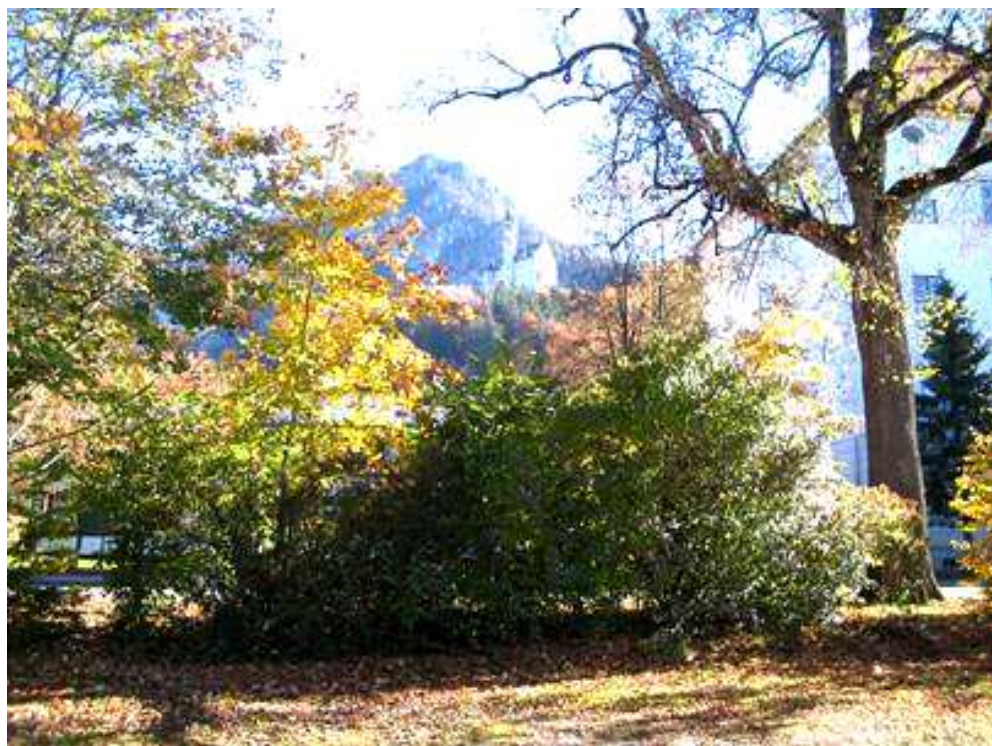
Vista del castello dal parcheggio e dalla partenza dei calessi trainati dai cavalli