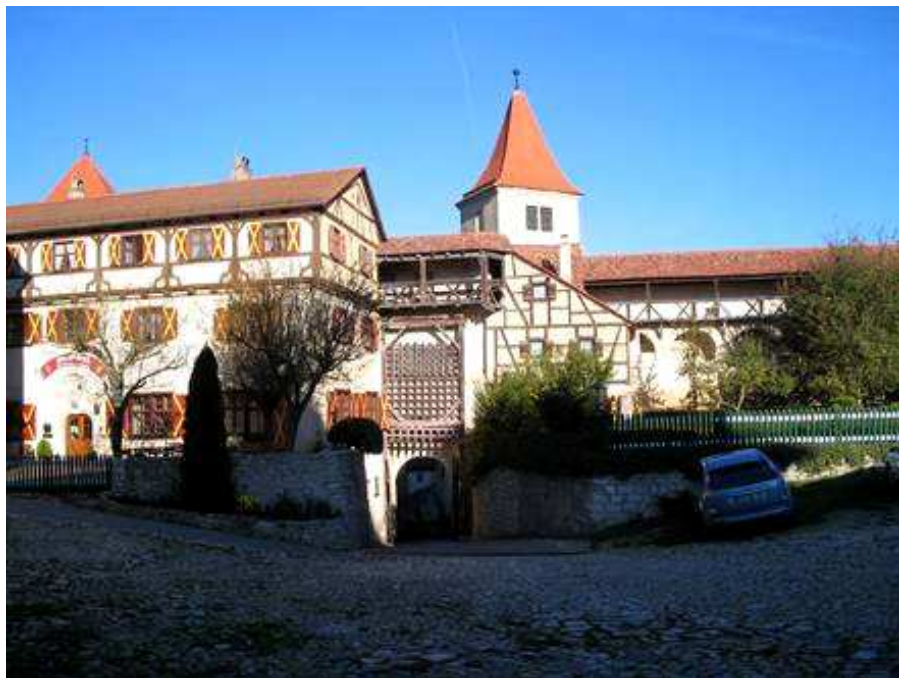
Ingresso al Castello