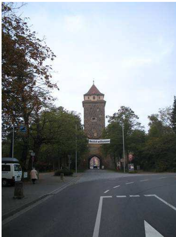
Ingresso porta Nord esterno