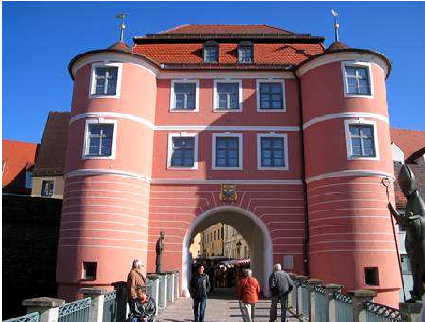
Porta di Ingresso alla città di Donauworth