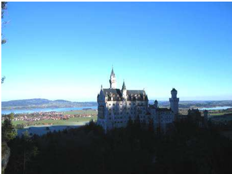
Vista del castello dal Marienbrucke