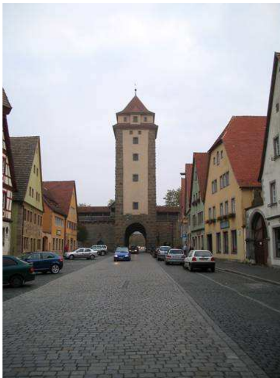
Ingresso porta nord interno