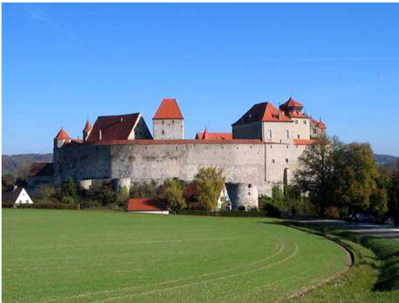
Il castello di Harburg

Dopo aver passato una notte tranquilla e fatta una sonora dormita che ha smaltito le fatiche della giornata precedente, dopo colazione ci spostiamo al Castello di Harburg e lo visitiamo, purtroppo solo dall'esterno poi che e' chiuso per la visita interna.