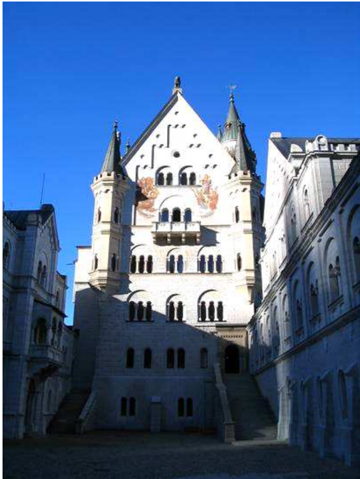
cortile interno del castello