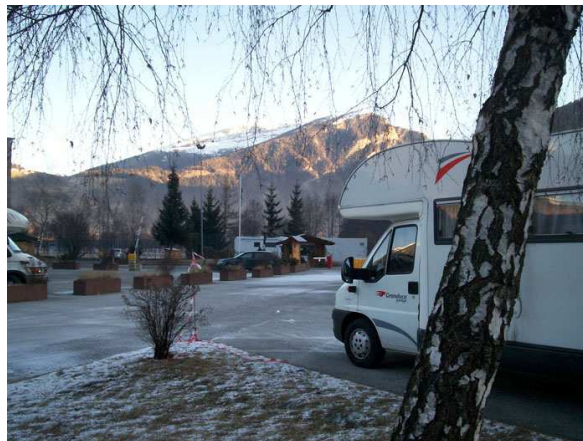
AA Autocamp Brennero

Quindi via verso la prima tappa del nostro viaggio, l'AA Autocamp al Brennero dove arriviamo verso le 21.00 e dove passeremo la notte. (euro 11 con carico/scarico/elettricità).