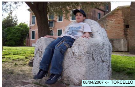
08/04/2007 -> TORCELLO