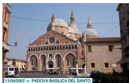
11/04/2007 -> PADOVA BASILICA DEL SANTO