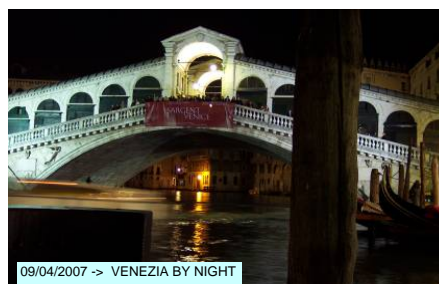
09/04/2007 -> VENEZIA BY NIGHT