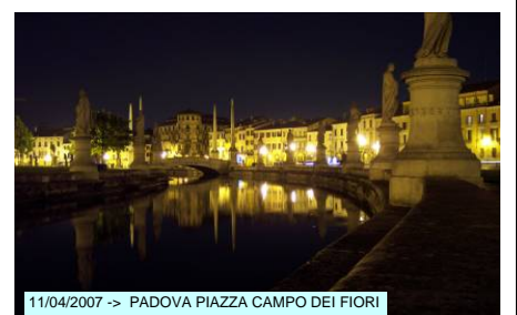
11/04/2007 -> PADOVA PIAZZA CAMPO DEI FIORI