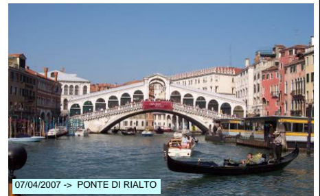
07/04/2007 -> PONTE DI RIALTO