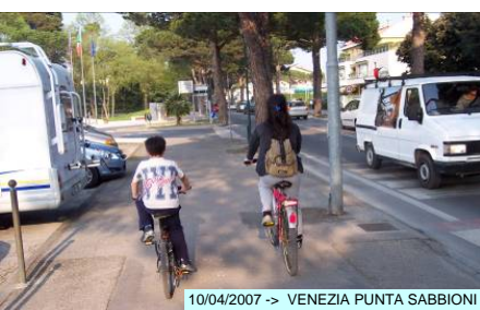
10/04/2007 -> VENEZIA PUNTA SABBIONI