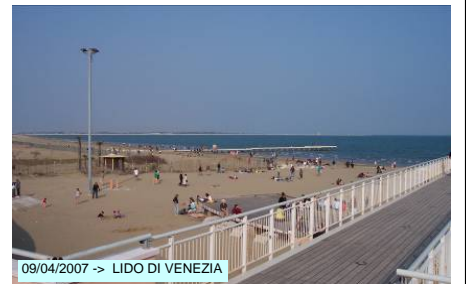
09/04/2007 -> LIDO DI VENEZIA