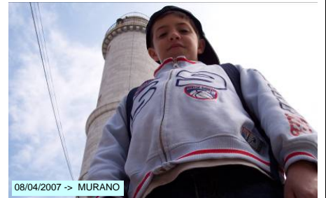
08/04/2007 -> MURANO