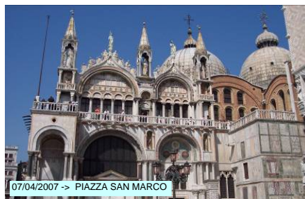
07/04/2007 -> PIAZZA SAN MARCO