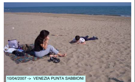
10/04/2007 -> VENEZIA PUNTA SABBIONI