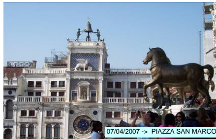
07/04/2007 -> PIAZZA SAN MARCO