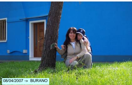
08/04/2007 -> BURANO