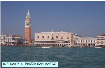
07/04/2007 -> PIAZZA SAN MARCO