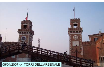
09/04/2007 -> TORRI DELL'ARSENALE