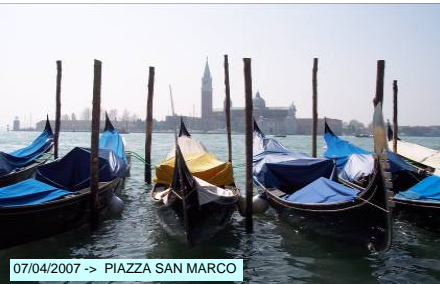
07/04/2007 -> PIAZZA SAN MARCO